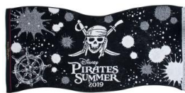
浴巾 3,400 日圓