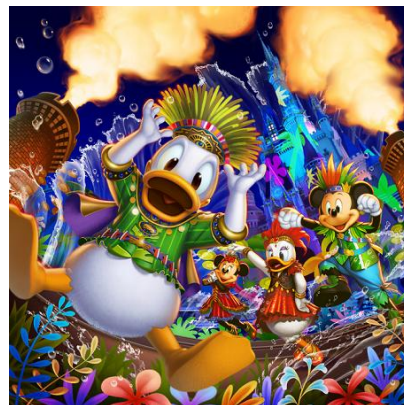
東京迪士尼樂園 「唐老鴨的熱力盛夏叢林」

於2019年7月9日至9月1日期間，東京迪士尼樂園將舉辦全新主題的特別活動「唐老鴨的熱力盛夏叢林」，帶來夏季獨有的歡快景致。屆時，夜間舞台娛樂表演將相隔6年於灰姑娘城堡前登場，並上演嶄新內容「噢！夏日萬歲！」。星空下，唐老鴨與其他迪士尼明星皆會陸續登場，引領遊客走進五顏六色的叢林世界。生動趣味的演出將結合大量清涼水花、熊熊火焰特效展現歡騰活力，令園區於夏夜更添熱鬧。