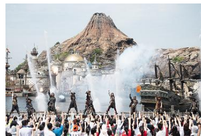
東京迪士尼海洋 「迪士尼夏日海盜世界」

同一期間，東京迪士尼海洋則將再度以迪士尼系列電影《神鬼奇航》為主題，呈獻洋溢冒險氣氛的特別活動「迪士尼夏日海盜世界」。傑克船長、巴博沙船長將率領狂野不羈的海盜們演出娛樂表演「海盜烈夏交鋒：溼不可擋！」。在滂湃飛瀑的水花中，遊客將彷彿成為海盜團的成員，置身於震撼迫人的戰役現場。