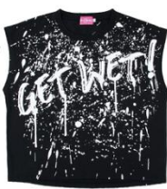
女用 T 恤 (M~L) 2,600 日圓