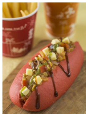
「小憩店」 特別套餐 960 日圓