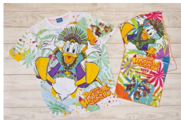
T 恤 100、120 公分 每款 1,900 日圓 140 公分 2,300 日圓 S、M、L、LL 每款 2,600 日圓 3L 2,900 日圓