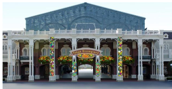
入園口內的園區裝飾

入園口內將布置色彩斑斕的園區裝飾，宛如生意盎然的夏日叢林。身穿鮮豔服飾的迪士尼明星亦會躍入其中，增添更上層樓的歡欣氣氛。