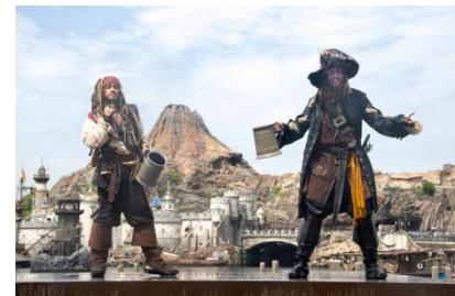
「海盜烈夏交鋒：溼不可擋！」