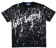
男用 T 恤 (M~L) 2,600 日圓

約 70 款散發濃厚海盜氛圍的特別商品將於園區上市。T 恤、浴巾、手環等品項將運用海盜旗等圖樣，呈現迪士尼電影《神鬼奇航》的冒險世界。把手玻璃杯將營造彷彿暢飲言歡的海盜豪邁氣氛。除上述之外，不僅迪士尼明星裝扮成海盜出航冒險的情境將會登上 T 恤，海盜風格十足的耳朵造型帽、滿載各式趣味元素的玩具等品項亦會登場。