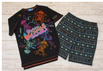
T 恤 S、M、L、LL 每款 2,600 日圓 五分褲 M、L 每款 2,300 日圓

約 80 款特別商品將以「唐老鴨的熱力盛夏叢林」為主題，於燦陽映照的園區注入源源不絕的活力。T 恤、五分褲、玩偶別針等品項可供遊客相偕打造亮眼裝扮，度過開懷盡興的夏日遊園時光。螢光手環獨具魅力，將是夏夜裡絢麗多彩的注目焦點。此外，唐老鴨的身影將會成為抱枕的造型，或是面紙盒套的立體裝飾，在豐富多樣的品項中展現驚豔風采。