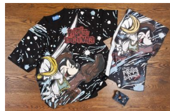
T 恤 100、120 公分 每款 1,900 日圓 140 公分 2,300 日圓 S、M、L、LL 每款 2,600 日圓 3L 2,900 日圓 手環 900 日圓