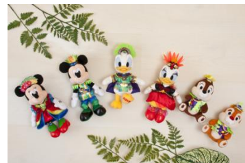
玩偶別針 每款 1,700 日圓 (奇奇、帝帝套組 2,800 日圓)