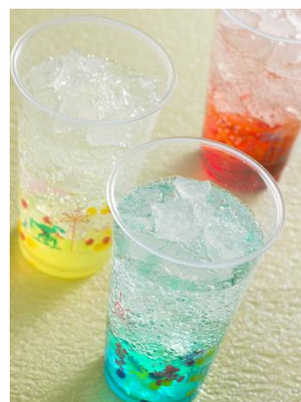
「蒸氣鍋爐房小吃」 氣泡飲料（晶藍口味） 「虎克船長的廚房」 氣泡飲料（檸檬口味） 「輝兒杜兒路兒好時光咖啡」 氣泡飲料（樹莓口味） 每款 380 日圓