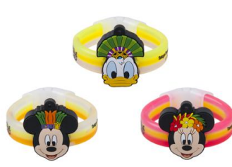
螢光手環 每款 500 日圓