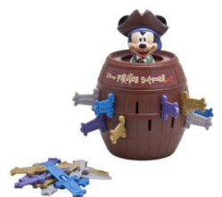
玩具 2,000 日圓