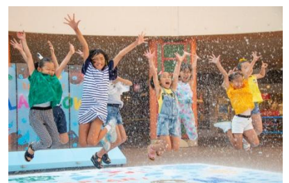
伊克斯皮兒莉 2018 年夏季活動實景

位於舞濱車站前的複合式購物娛樂商城「伊克斯皮兒莉」將自 7 月下旬舉辦夏季活動。屆時，商城 2 樓的慶典廣場將有清涼的水花節目、適合親子參加且寓教於樂的工作坊等，多樣魅力精彩紛呈。此外，品項豐富的夏季戶外活動服飾、休閒用品，以及令人暑氣全消的清涼甜品等皆將登場。歡迎遊客蒞臨這座商店、餐飲設施、影城一應俱全的歡欣小鎮，度過美好的夏日假期！