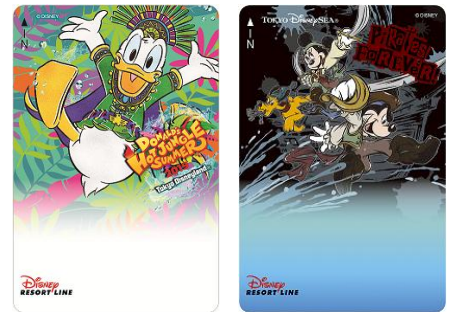
期間限定款周遊券

迪士尼度假區線亦會令乘車時光洋溢 2 座園區的活力氛圍。獨家周遊券、獨家紀念幣將以特別活動「唐老鴨的熱力盛夏叢林」、「迪士尼夏日海盜世界」作為設計主題，並於各座車站的自動售票機或紀念幣販賣機銷售。