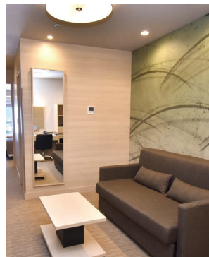
左(淡): SUPERIOR TWIN BAYVIEW / 右(濃): STANDARD CORNER DOUBLE

Guestrooms are located on floors 15・16・19-24・26 from where you can enjoy the splendid view from up high. Spectacular night view of Pleasure Town Seacle and Rinku Premium Outlet on the South and fascinating Airport view on the West are especailly scenic.