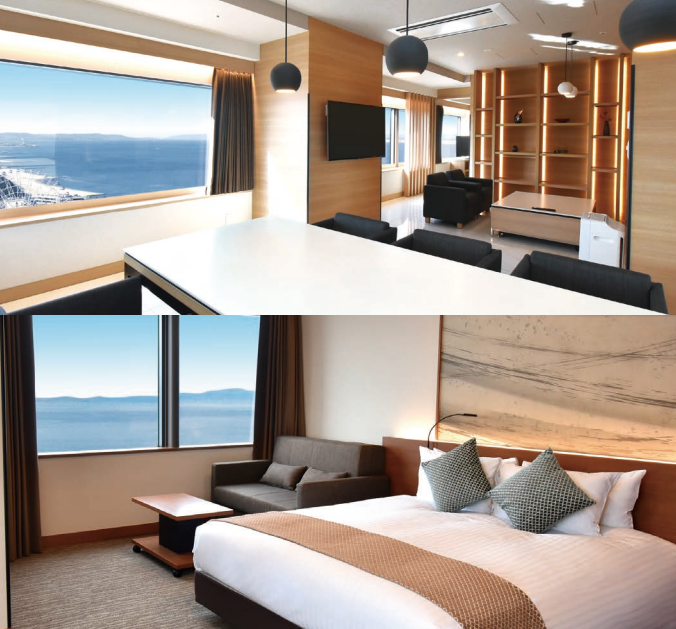
上: ODYSYS SUITES / 下: DELUXE CORNER DOUBLE BAYVIEW