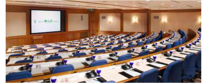
Conferences | カンファレンス