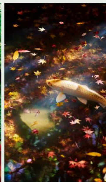
Autumn Leaves 紅葉