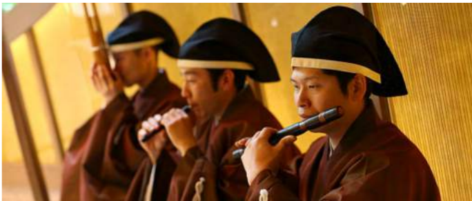
Shrine and Shinto Experience MORINOMIYA | 神社神道体験