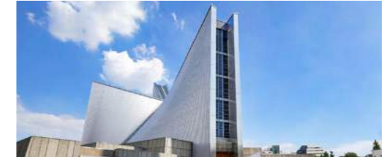
1 St. Mary's Cathedral Tokyo | 東京カテドラル聖マリア大聖堂