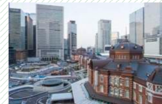
Tokyo Station 東京駅