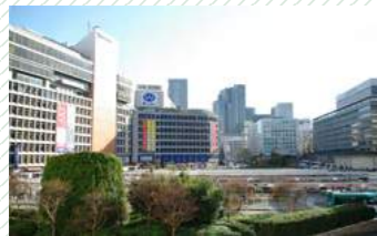
Shinjuku Station 新宿駅