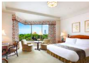
Prime Superior プライムスーパーリア