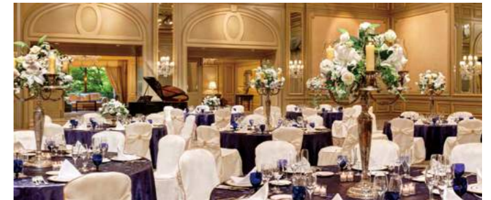
Gala Dinners | ガラディナー