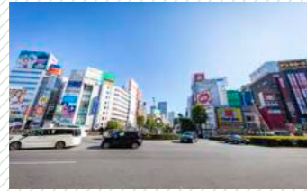
Ikebukuro Station 池袋駅