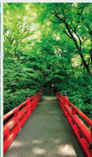
Deep Green 深緑