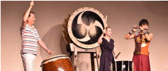
Wadaiko Experience | 和太鼓体験