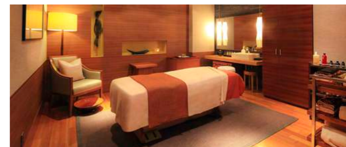
Treatment Rooms | トリートメントルーム(7室/メニュー約40種類)