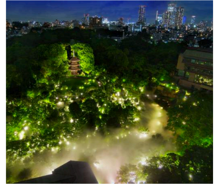
One Thousand Lights 千の光