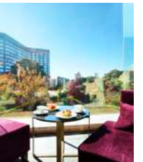
Foresta | フォレスタ