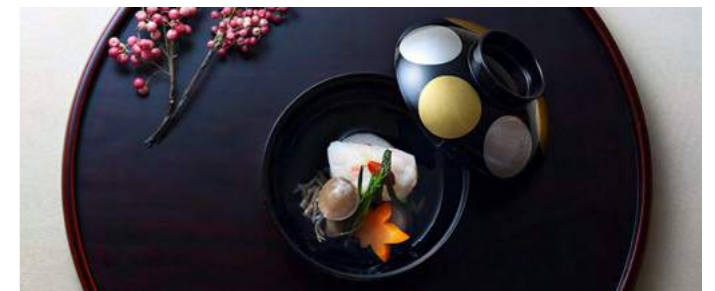
Table Manners | テーブルマナー