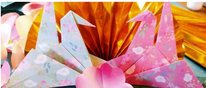
Origami | 折り紙体験