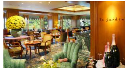
Le Jardin | ル・ジャルダン