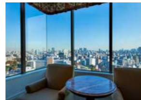
City View シティビュー