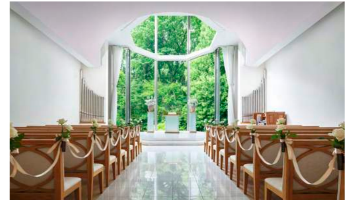
Chapel | チャペル