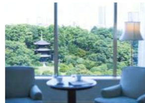
Garden View ガーデンビュー