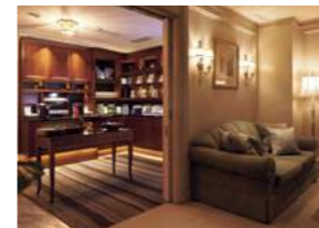
Pagoda Lounge パゴダラウンジ