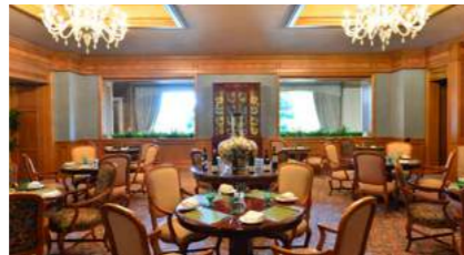
The Bistro | ザ・ビストロ