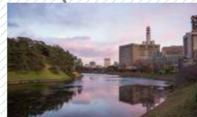
Imperial Palace 皇居