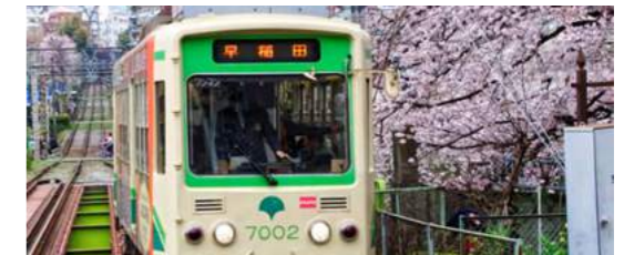
3 Tokyo Sakura Tram | 路面電車