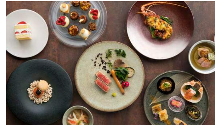
The Tokyo Cuisine | 料理