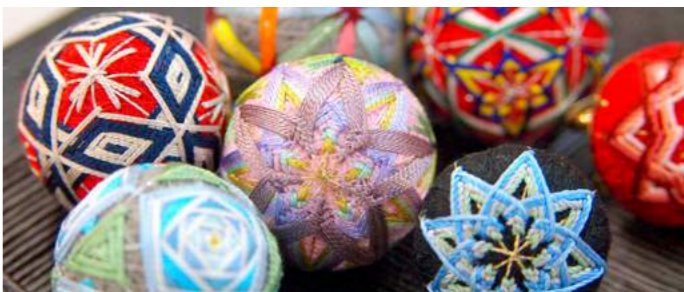
Kaga Temari | 加賀てまり作り体験