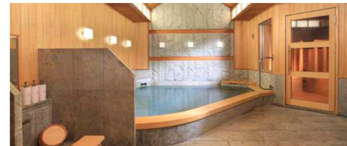
Hot Spring | 静岡県伊東の温泉