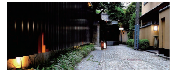
4 Kagurazaka area | 神楽坂