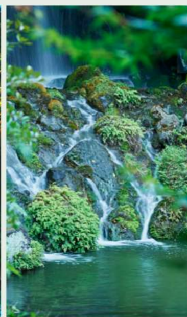
Cool Summer 涼夏