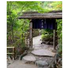
Mucha-an | 無茶庵