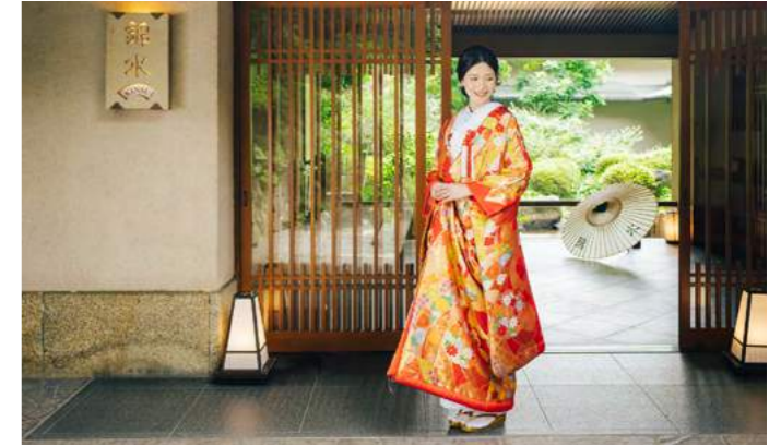
Japanese Wedding Dresses | 和装