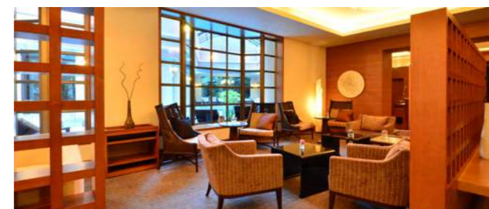
Spa Lounge | スパラウンジ