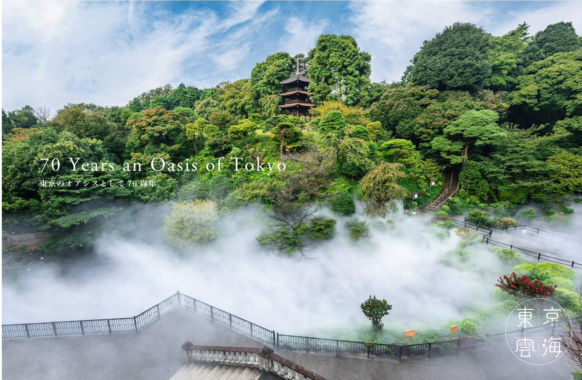
Tokyo Sea of Clouds 東京雲海