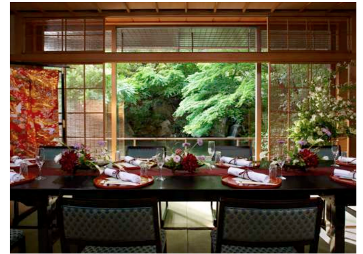
Ryotei Kinsui | 錦水