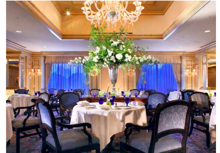
Il Teatro | イル・テアトロ