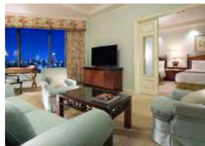
Prime Executive Suite プライムエグゼクティブスイート