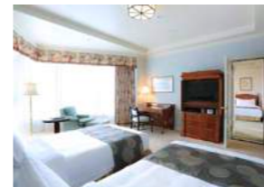
Connecting Rooms コネクティングルーム