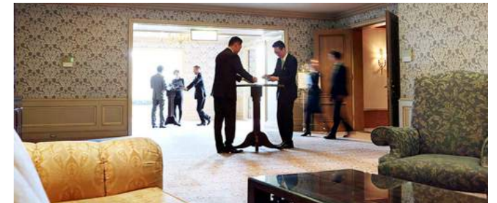
Business Meetings | ビジネスミーティング