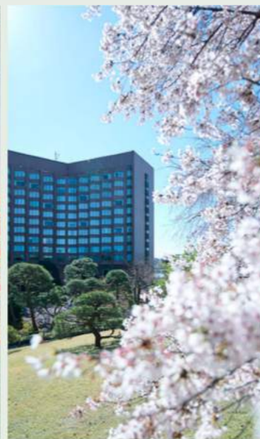
Cherry Blossoms 桜