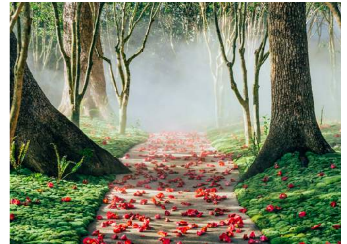
Tokyo Camellia 東京椿