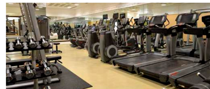
Fitness Gym | フィットネスジム