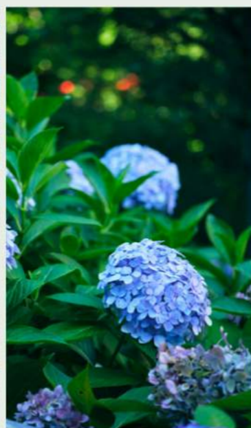
Fresh Green 新緑