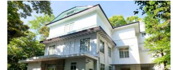
2 Eisei Bunko Museum | 永青文庫