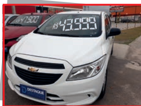
(07) PRISMA JOY - Motor 1.0 - 2018 completo - branco - PL: 1543 Mensais a partir de R$ 589,00