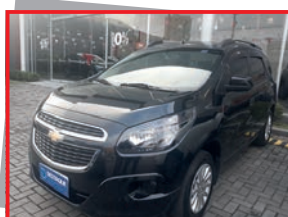
(12) SPIN LT - 2016 - preto - PL: 9876 Mensais a partir de R$ 659,00