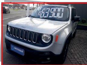
(18) JEEP RENEGADE SPORT MT 2016 - PL: 0059 Mensais a partir de R$ 889,00