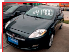
(04) BRAVO ABSOLUTE DUAL - 2014 preto - PL: 9995 Mensais a partir de R$ 559,00