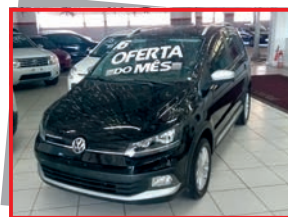
(19) VOLKS SPACE CROSS 1.6 MT 2016 - 4 portas - preto - PL: 8184 Mensais a partir de R$ 899,55