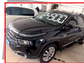
(20) TORO VOLCANO - 2019 preto - PL: 9619 Mensais a partir de R$ 1.698,00