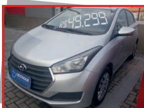
(13) HB-20 1.6 - 2018 - prata - PL: 7288 Mensais a partir de R$ 678,00