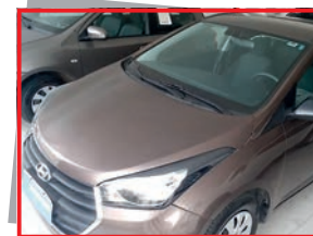
(10) HYUNDAI HB 20 COMFORT 1.0 - MT 2018 - compl - marrom - PL: 9537 Mensais a partir de R$ 649,88