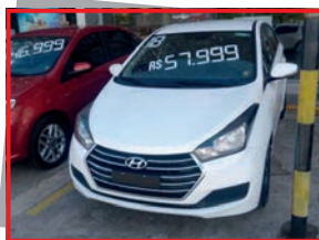
(17) HYUNDAI HB20S COMFORT PLUS 2018 - 1.6 AT - branco - PL: 7138 Mensais a partir de R$ 869,22