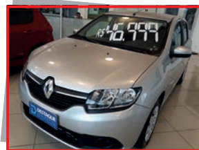
(09) SANDERO EXP 1.0 - 2019 completo - prata - PL: 4311 Mensais a partir de R$ 649,00