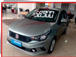
(16) ARGO PRECISION - 2018 cinza - PL: 7435 Mensais a partir de R$ 789,00