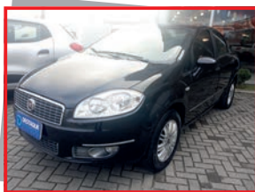
(01) LINEA LX - 1.8 - 2012 - Manual preto - PL: 6679 Mensais a partir de R$ 447,00

PLANTÃO ESPECIAL SÓ NESTA SEXTA, SÁBADO E DOMINGO DAS 8h ATÉ ÚLTIMO CLIENTE APROVEITE!