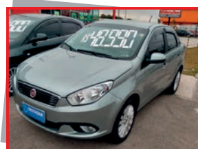
(14) GRAND SIENA ESSENCE - 2017 cinza - PL: 9917 Mensais a partir de R$ 698,00