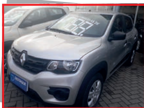
(06) KWID ZEN - 2019 prata - PL: 3012 Mensais a partir de R$ 575,00