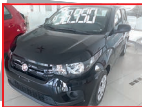
(03) MOBI DRIVE - 1.0 - 2018 preto - PL: 3344 Mensais a partir de R$ 529,00