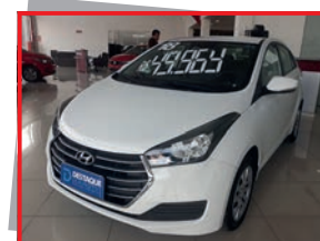
(15) HB-20S 1.0 - COMFORT PLUS - MT 2018 - PL: 8813 Mensais a partir de R$ 698,00