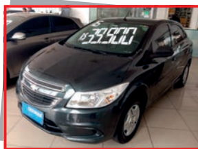
(02) ONIX LT - 2016 - Manual preto - PL: 9442 Mensais a partir de R$ 495,00