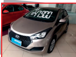
(11) HB20 COMFORT PLUS - 2019 completo - prata - PL 6620 Mensais a partir de R$ 649,00