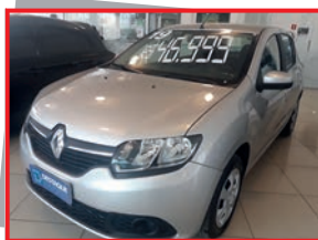
(08) SANDERO EXP - 2019 prata - PL: 4387 Mensais a partir de R$ 649,00