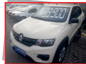
(05) KWID ZEN - 2019 bege - PL: 2830 Mensais a partir de R$ 575,00