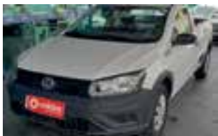
Saveiro Robust 1.6 msi / 2018 / COMPLETO