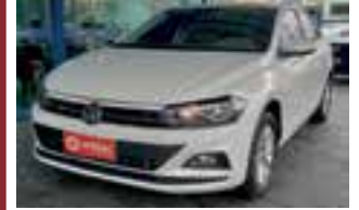
Virtus Comfortline 200 tsi 1.0 aut. / 2019