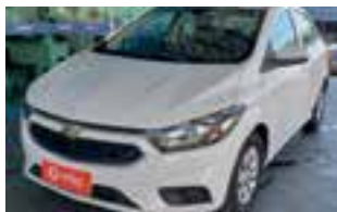
Onix LT 1.0 2019 / COMPLETO