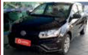
Voyage 1.6 msi / completo / 2019