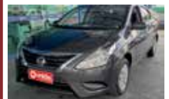
Nissan Versa 1.0 Conforto / COMPLETO