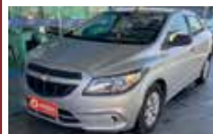
Prisma Joy 1.0 2019 / COMPLETO