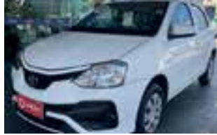
Etios Hatch 1.3x 2019 / completo