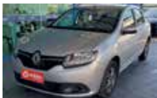
Renault Logan Advantage 1.0 2019 / COMPLETO