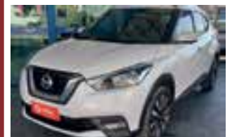
Kicks SL At 1.6 4p / 2018 / AR DH AUT