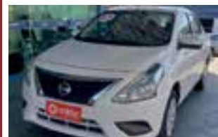
Nissan Versa 1.6 s / 2017 / COMPLETO