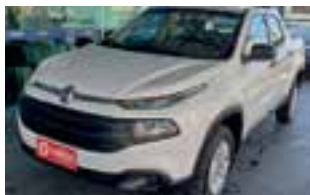
Fiat Toro Freedom flex / 4x2 / aut. / 2018