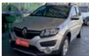
Renault Sandero Stepway 1.6 SCE / 2019 / COMPLETO