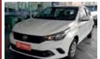
Fiat Argo Drive 1.0 2019 / COMPLETO