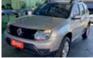
Renault Duster Expression 1.6 COMPLETO