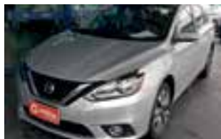
Sentra SV aut. / 2018