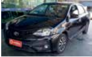
Etios Sedan Xls At 1.5 / 4p / 2019 / AR DH AUT

APRESENTE ESSE ANÚNCIO E GANHE DOCUMENTAÇÃO GRÁTIS!!!