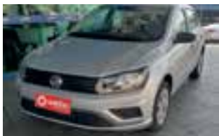
Gol G6 1.6 msi / 4 portas / completo / 2019