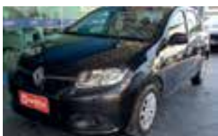
Renault Logan Expression 1.0 SCE / COMPLETO