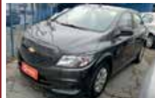
Prisma joy 1.0 2019 / COMPLETO