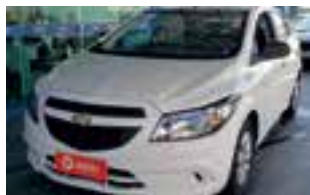
Onix joy 1.0 2019 / COMPLETO