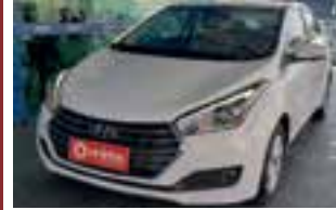
hb20s Premium 1.6 aut / 2017