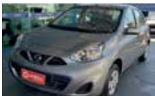
Nissan March s 1.0 2019 / COMPLETO

R$ 41.990,00 entrada mais parcelas de R$ 999,00