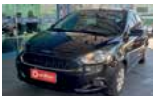
Ford Ka Hatch 1.5 SE / 2018 / COMPLETO