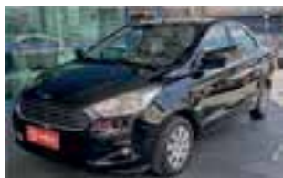
Ford Ka + 1.5 Se / 2018 / COMPLETO

R$ 41.990,00 entrada mais parcelas de R$ 999,00