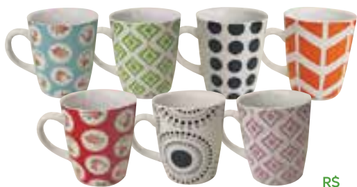
CANECA DE PORCELANA 275 ML SORTIDA Código: 3198070