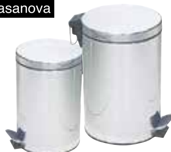
LIXEIRA DE INOX COM PEDAL CROMADA CASANOVA