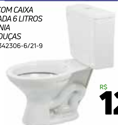
BACIA COM CAIXA ACOPLADA 6 LITROS GARDÊNIA MARI LOUÇAS Código: 342306-6/21-9