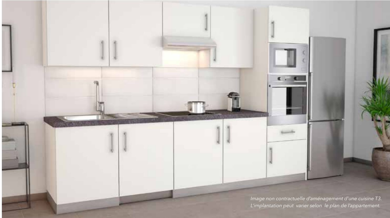
Image non contractuelle d'aménagement d'une cuisine T3. L'implantation peut varier selon le plan de l'appartement.