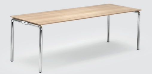
Bespreek- en vergadertafels Voor een groter gezelschap zijn verschillende configuraties qua vorm en grootte beschikbaar.