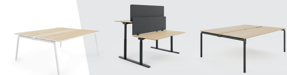
Teamwerkplekken Als A-poot werkblad, T-poot dubbel werkblad en werkblad met 4-pootframe verkrijgbaar.