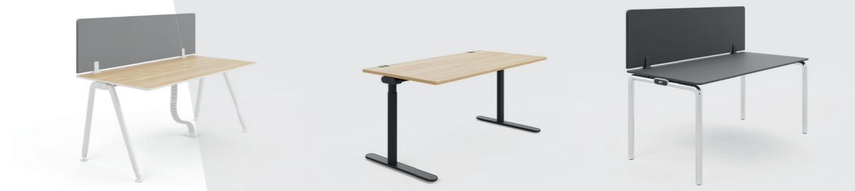
Afzonderlijke werkplekken Als A-poot, T-poot of 4-poot verkrijgbaar.