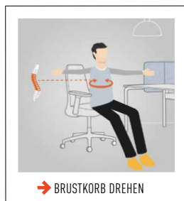
→ BRUSTKORB DREHEN

Heben Sie die Arme nach oben und strecken Sie abwechselnd die Hände zur Decke. Beim Strecken einatmen. Sie dehnen damit die Flanken und weiten den Brustkorb. Der Blick kann den Händen folgen. Auf jeder Seite 5-mal wiederholen