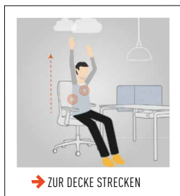
→ ZUR DECKE STRECKEN

Heben Sie die Arme nach oben und strecken Sie abwechselnd die Hände zur Decke. Beim Strecken einatmen. Sie dehnen damit die Flanken und weiten den Brustkorb. Der Blick kann den Händen folgen. Auf jeder Seite 5-mal wiederholen