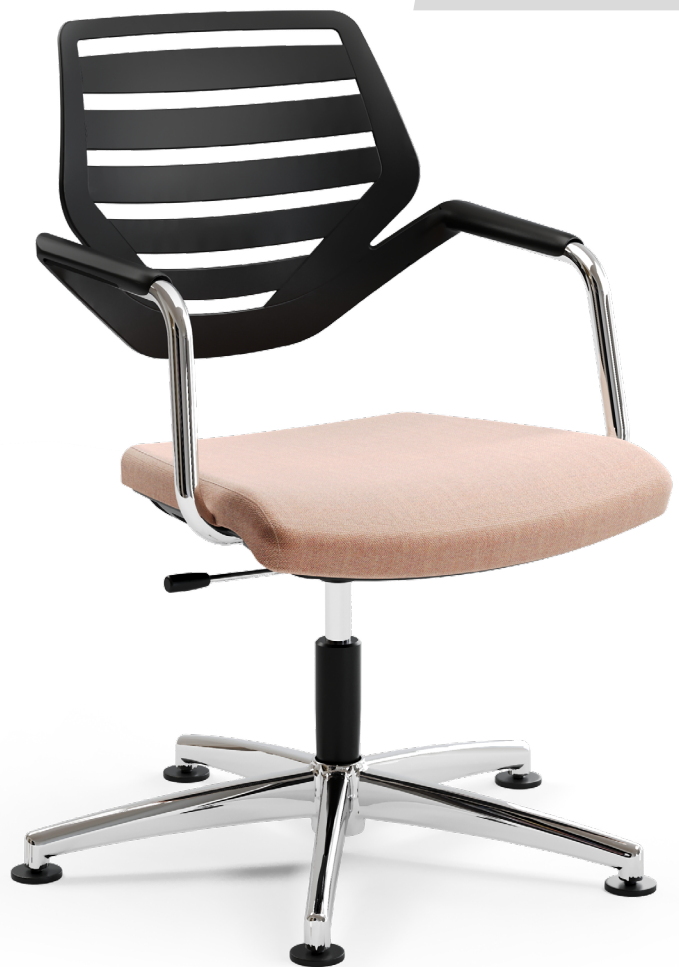
K+N NOOK Freitragender Rücken mit oder ohne Rückenpolster erhältlich.