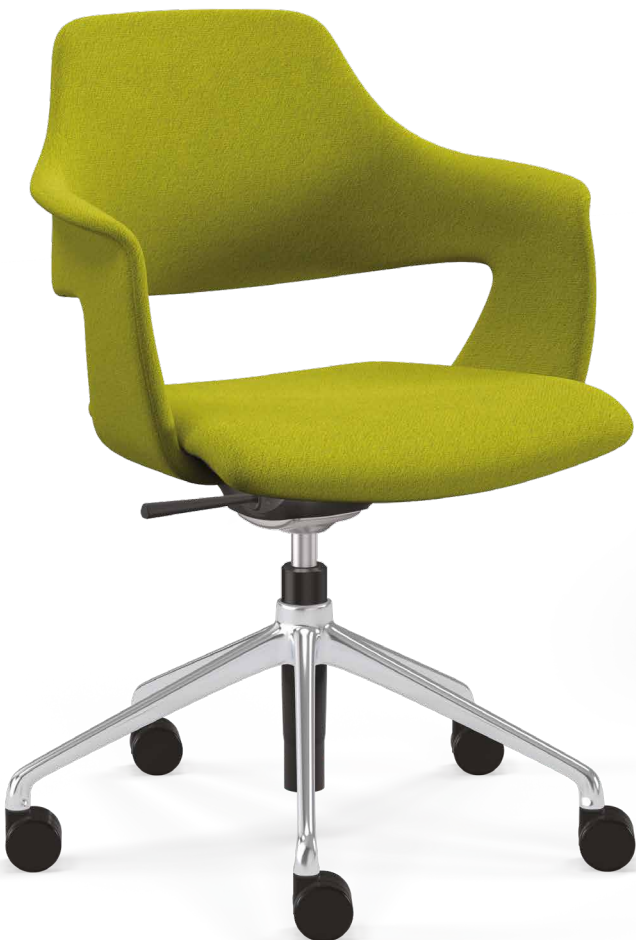
K+N NOOK.SHELL Kunststoffschale mit oder ohne Polster sowie als Vollpolster-Variante erhältlich.