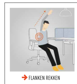
→ FLANKEN REKKEN

Ga voor op uw stoel zitten, zet uw voeten stevig op de grond en strek de armen ver naar opzij uit. Draai uw bovenlichaam aandachtig verder naar rechts, zodat de hele wervelkolom vanaf de onderrug tot aan de nek wordt geactiveerd. U kunt de linkerhand ook ter ondersteuning tegen de buitenkant van de rechterknie houden. Dit stimuleert de tussenwervelschijven, verruimt de spieren van de borstkas en rekt de rugspieren. Herhaal dit 5 tot 10 keer aan elke kant.