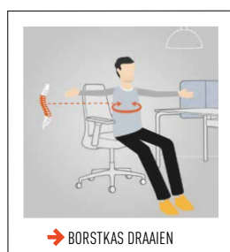
→ BORSTKAS DRAAIEN

Hef de armen naar boven en strek afwisselend de handen richting plafond. Adem bij het strekken in. U rekt hiermee de flanken uit en maakt de borstkas breder. Uw blik kan de handen volgen. Herhaal 5 keer aan elke kant.