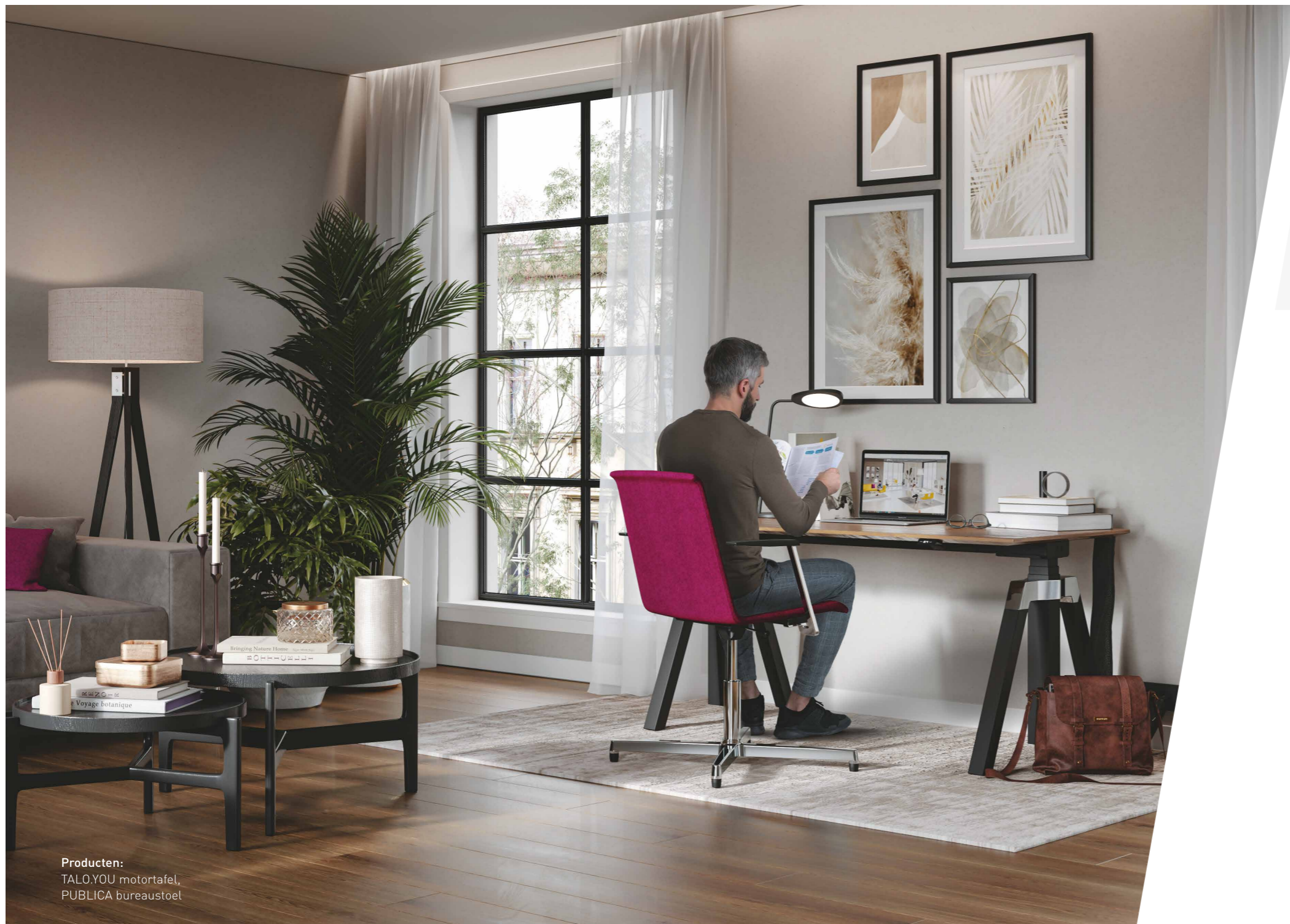
Producten: TALO.YOU motortafel, PUBLICA bureaustoel

Ons team kent de uitdagingen bij de inrichting van kantoren waar het zowel goed werken als prettig toeven is. Dankzij onze jarenlange ervaring in de inrichting en vormgeving van kantoorruimten leveren wij u in ons tweede workbook ideeën over hoe de werkplek ontspannen in de woonkamer kan worden geïntegreerd.