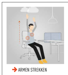
→ ARMEN STREKKEN

Hef de armen naar boven en strek afwisselend de handen richting plafond. Adem bij het strekken in. U rekt hiermee de flanken uit en maakt de borstkas breder. Uw blik kan de handen volgen. Herhaal 5 keer aan elke kant.