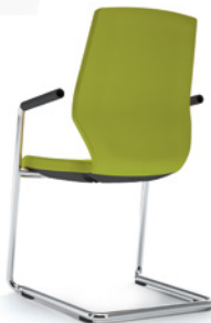
FREISCHWINGER mit Armlehnen