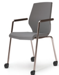
VIERFUSS AUF ROLLEN nur mit Armlehnen

VIER RÜCKEN- VARIANTEN Vollpolster, Netz, 3D-Netz, Kunststoffschale