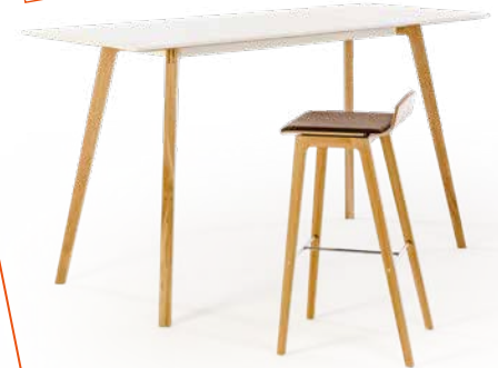
BEHAAGLIJK ALTERNATIEF Statafel en MOVE.MIX barkruk (hier met lage leuning) met gefineerde poten