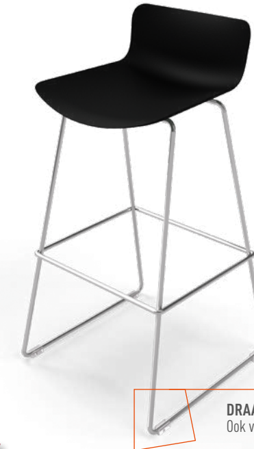
DRAADFRAME Ook verkrijgbaar in zwart