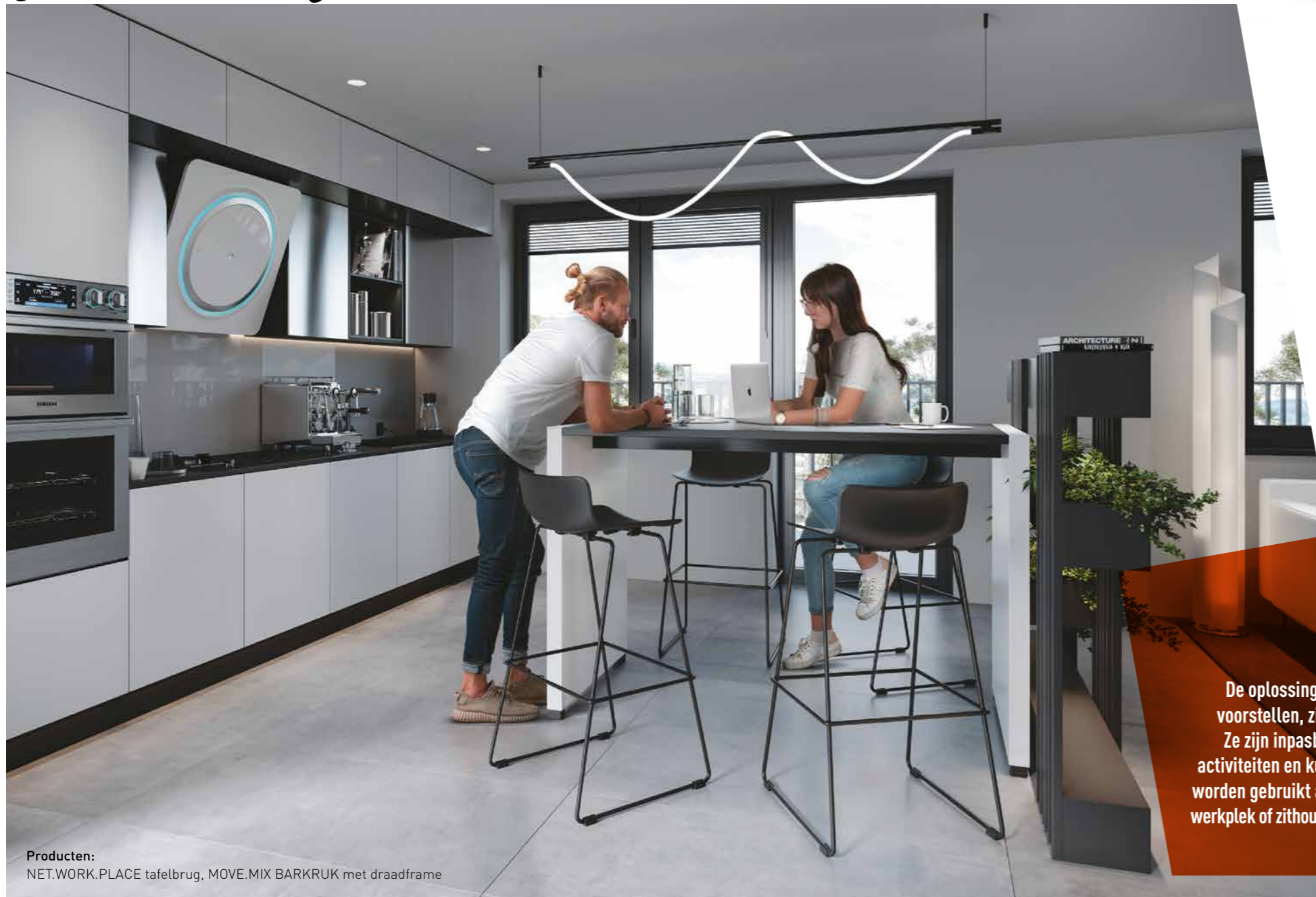
Producten: NET.WORK.PLACE tafelbrug, MOVE.MIX BARKRUK met draadframe

+ Door akoestisch werkzame fronten kunt u hier zelfs geluid isoleren.