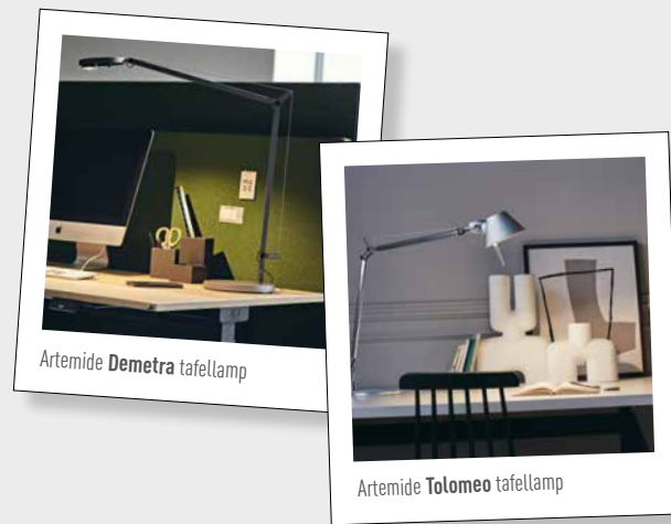
Artemide Demetra tafellamp

Op de werkplek is rechtstreekse, dus gerichte verlichting het best, die bijvoorbeeld wordt geboden door tafellampen van onze merkpartner Artemide. Diffuse of indirecte verlichting werkt vooral sfeerverhogend en heeft een decoratief karakter.