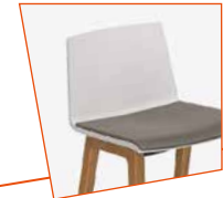
ZITSCHAAL Ook mogelijk met hoge leuning