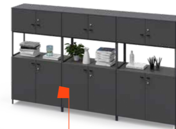
ACTA.PLUS Tussenframe-kast in zwart

In een keuken ziet u het effect van het 2:8-principe het duidelijkst: u zorgt voor een rustig ruimtelijk effect door het grootste deel van het keukengerei buiten het zicht op te bergen. Interieurexperts adviseren 20% van de spullen (bij voorkeur de fraaie) zichtbaar naar te zetten en 80% op te bergen. Hieruit concluderen wij: het geheim van een evenwichtige interieurinrichting is vooral een kwestie van intelligent gebruik van bergruimte.