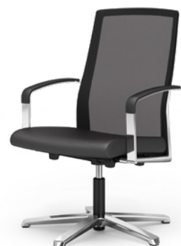
B SIÈGE CONFÉRENCE AGENDA.II