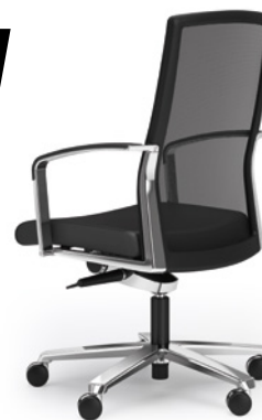
A SIÈGE DE DIRECTION AGENDA.II