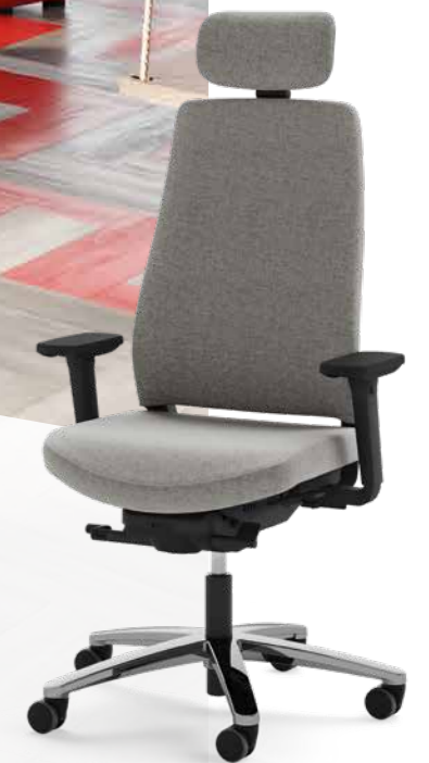
OKAY.III en variante rembourrage intégral

Ici, nous présentons des espaces de travail avec les sièges pivotants OKAY.III et des tables ACTIVE.T réglables en hauteur, des espaces de réunion confortables avec NET.WORK.PLACE et la QUIET.BOX Duo pour des conversations entre quatre yeux. Grâce à son soutien-nuque, OKAY.III assure que même les longues journées de travail restent dynamiques et détendues.