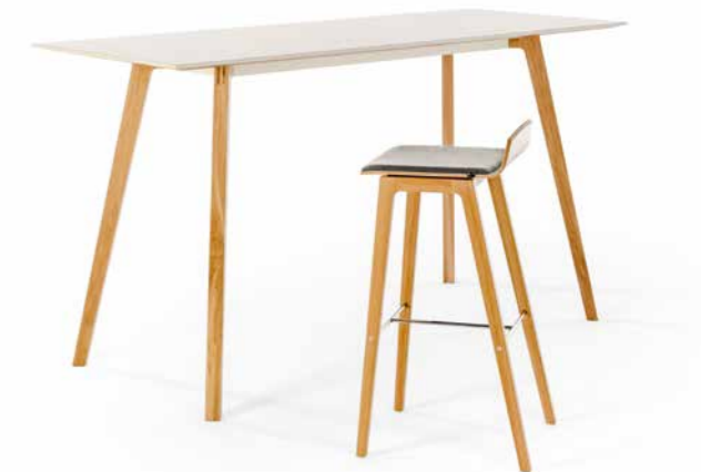
Table de réunion avec MOVE.MIX

Tables emboîtables à deux hauteurs pour plus de flexibilité et de mobilité dans les réunions.