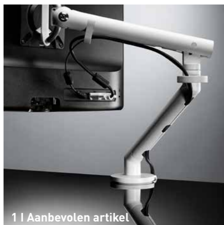
1 | Aanbevolen artikel