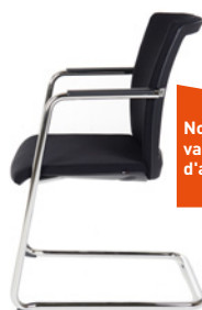
PIÉTEMENT LUGE Accoudoir droit