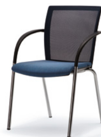
4 PIEDS Dossier résille