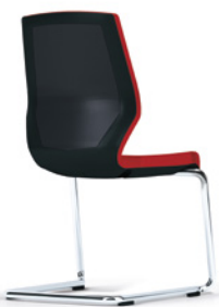
PIÉTEMENT LUGE sans accoudoirs