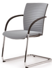
PIÉTEMENT LUGE Dossier à surpiqûres horizontales