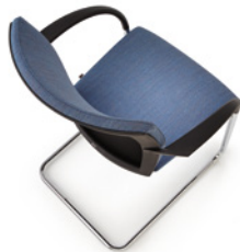
PIÉTEMENT LUGE Dossier rembourré