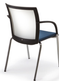
4 PIEDS Dossier en maille 3D