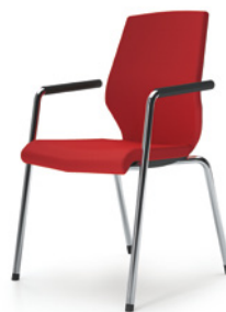
4 PIEDS avec accoudoirs