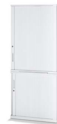
ARMOIRE COMBINÉE COMBIKAST

GRÂCE À LEUR DIVERSITÉ, LES FAÇADES S'HARMONISENT AVEC TOUS LES TYPES D'AGENCEMENTS ET DE PIÈCES. LES PORTES BATTANTES, LES TABLETTES, LES PORTES COULISSANTES, LES VOIETS LATÉRAUX ET LES TIROIRS SONT COMBINABLES EN FONCTION DES BESOINS ET FONT DE CHAQUE VARIANTE UN POINT DE MIRE. LA TRAME DE HAUTEUR MODULAIRE DE DEUX À SIX HAUTEURS DE CLASSEUR EST À L'ORIGINE D'UNE MULTITUDE DE CONFIGURATIONS DU VOLUME DE RANGEMENT. IL EST AINSI POSSIBLE DE PERSONNALISER LE POSTE DE TRAVAIL EN FONCTION DU VOLUME DE RANGEMENT NÉCESSAIRE.