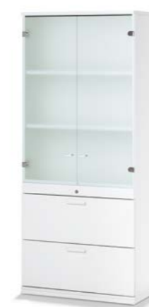
ARMOIRE COMBINÉE COMBIKAST