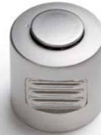
BOUTON TOURNANT DRAAIKNOP