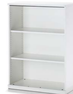
RAYONNAGE OPEN KAST