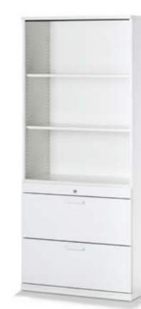
ARMOIRE COMBINÉE COMBIKAST