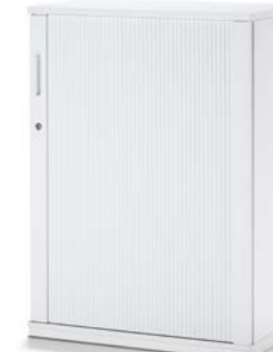
ARMOIRE À RIDEAU LATÉRAL JALOEZIEDRAAIDEURKAST