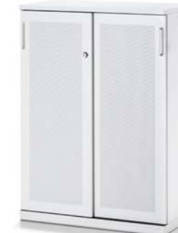
ARMOIRE À PORTE COULISSANTE AVEC FAÇADE ACOUSTIQUE SCHUIFDEURKAST MET AKOESTISCH FRONT