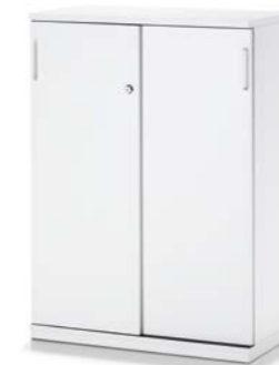
ARMOIRE À PORTE COULISSANTE SCHUIFDEURKAST