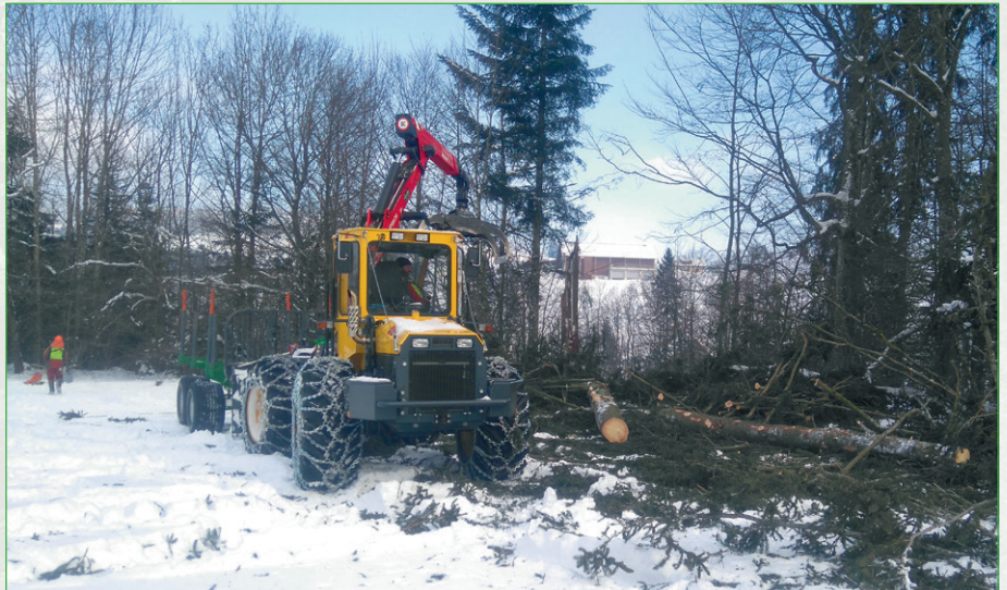
Im Winter wurden Arbeiten zur Waldrandaufwertung, wie hier im Geissboden, mit grosser Sorgfalt ausgeführt.

Im März hat die Forstequipe der Korporation Wollerau einen kleinen Holzschlag im Farengütsch an der Südseite des Höhronen ausgeführt. Es wurden insgesamt 110 m 3 alte Weisstannen gefällt. Dieser Holzschlag wurde aus zwei Gründen ausgeführt: Einerseits brauchte der Forstbetrieb das Weisstannenholz für einen Hangverbau am Kanalweg, andererseits konnte einer wunderschönen Verjüngung aus Fichten und Tannen geholfen werden, indem die alten Weisstannen aus dem Bestand gefällt wurden. Somit hat die Verjüngung mehr Platz, um ungestört wachsen und gedeihen zu können.