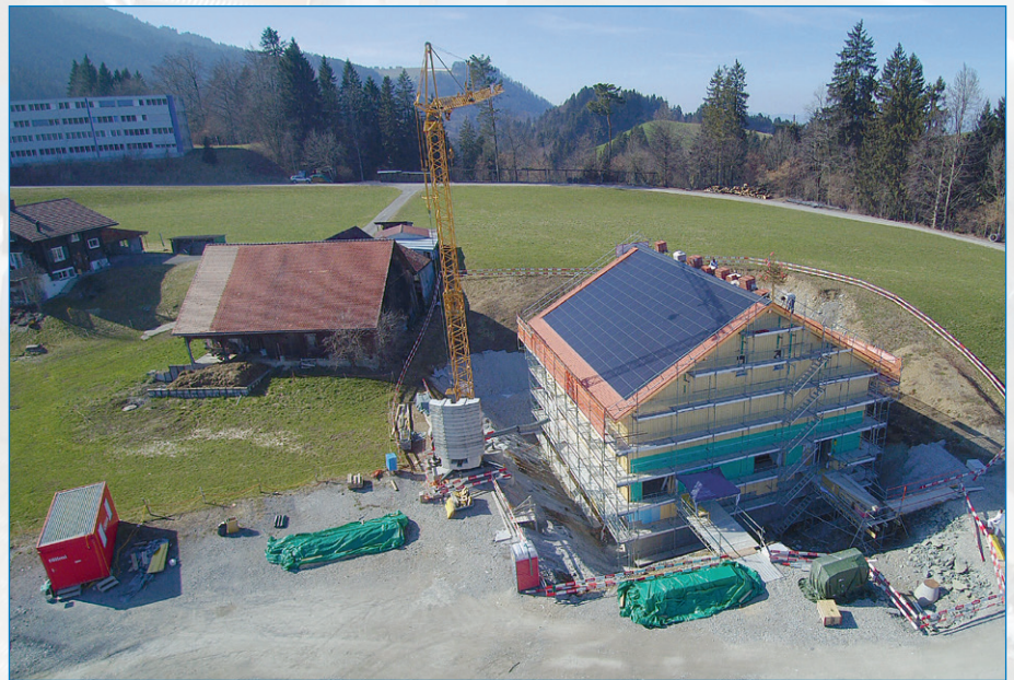
Das Wasseraufbereitungs-Gebäude bei der Geissboden-Quellfassung.

So ist man 365 Tage/24 Stunden lang bereit für dringende Reparaturen an Hausanschlussleitungen und Hausanschlüssen sowie plötzlich auftretende Wasserrohrbrüche. Sanierungen von Strassen, die von der öffentlichen Hand geplant sind, werden mit der Wasserversorgung koordiniert, um Synergien zu nutzen und sanierungsbedürftige Leitungen zeitgemäss zu ersetzen. Weiter stehen Quellmessungen, Bauanschlüsse und die Sanierung von