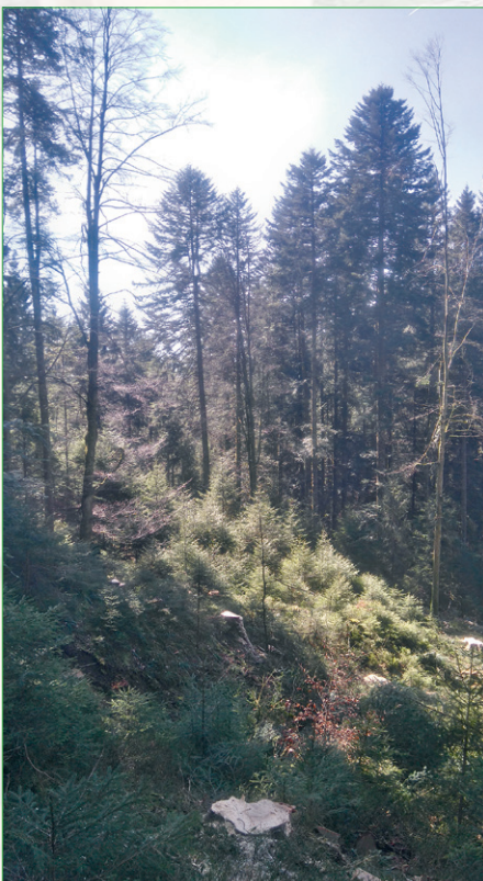
Nach dem Eingriff der Forstgruppe kann der Jungwuchs gedeihen.

Das Holz der Weisstanne ist ideal für einen Hangverbau, da es im Boden sehr langlebig ist. Es gilt dabei zu beachten, dass das Holz komplett mit Erde zugedeckt wird, damit es nicht verfault. Rund 85 m 3 davon wurden für den Holzkasten des Hangverbaus verwendet, ein LKW-Anhängerzug von 25 m 3 – vor allem dickere Stämme – wurden als Sägeholz verkauft.