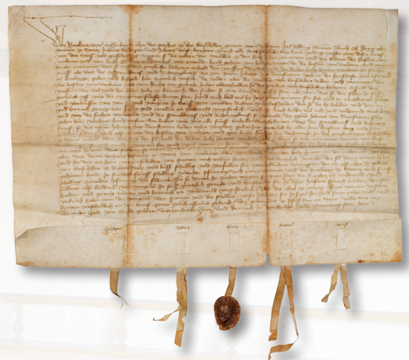
Urkunde eines Holzkonflikts mit dem Kloster Einsiedeln von 1427.

Im Korporationsarchiv befinden sich von fast allen Geschlechtern Register und Listen, die bis ins 16. Jahrhundert zurückreichen.