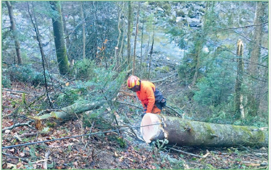
Oben: Schwere Arbeit im Forst, unten: Abtransport über Waldstrassen

optimal und uneingeschränkt erfüllen kann. Wichtig ist, dass man den Prozess der laufenden Verjüngung aufrechterhält, um die Bestände vor Überalterung zu schützen. Auf die Holzerei-Saison 15/16 hat die Korporation Wollerau im Gebiet Scheeren einen Schutzwaldkomplex angezeichnet. Das Gelände ist sehr steil und rutschig und an manchen Stellen mit Felsbändern durchzogen. Auf einer Fläche von rund 2,3 Hektaren wurden 421 Festmeter Holz