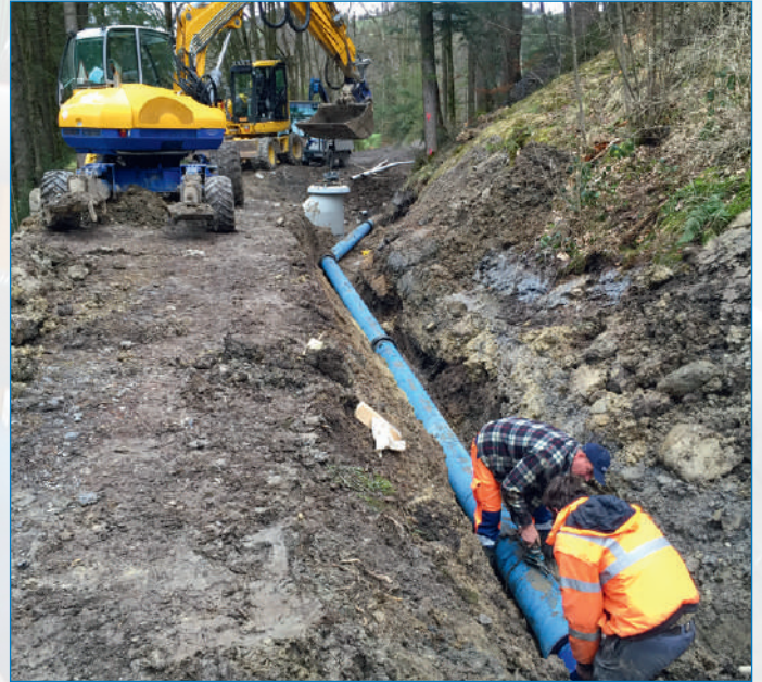
Oben/unten: Leitungsbau vom Geissboden zur Sihl, rechts: Transportleitung dem Kanalweg entlang nach Schindellegi

Das Wasser aus dem Grundwasserbrunnen Geissboden wird mit Sauerstoff angereichert, um das vorhandene Eisen/Mangan auszufiltern. Damit verbunden ist auch eine zweite Einspeisemöglichkeit in die Zone Chaltenboden durch ein Stufenpumpwerk Geissboden. Zur zweckmässigen Nutzung des Grundwassers Geissboden muss in der Zone Feusisberg-Schindellegi ein zusätzliches Reservoir (Reservoir Sihl) mit den ent-