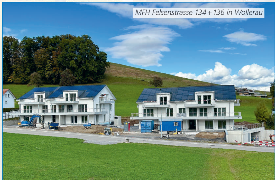
MFH Felsenstrasse 134+136 in Wollerau

Ein herzliches Dankeschön geht an alle beteiligten Firmen und ihre Mitarbeiter, die diesen Bau möglich gemacht haben. Der Erstbezug erfolgt per 1. Februar 2024.