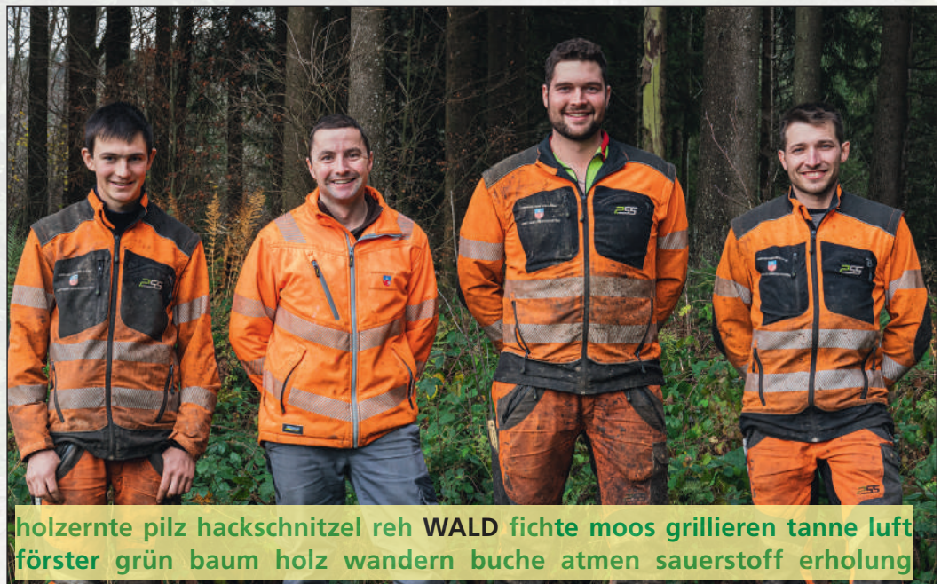
Die Forstgruppe der Korporation Wollerau im täglichen Einsatz.

Der Wald ist aber nicht nur eine wichtige Lebensgrundlage für den Menschen, er liefert auch den Rohstoff Holz, schützt vor Naturgefahren, ist Lebensraum für die Fauna und Flora und dient dem Menschen als Erholungsraum. Unser Ziel ist es, den Wald nach dem Nachhaltigkeitsprinzip naturnah, ökonomisch