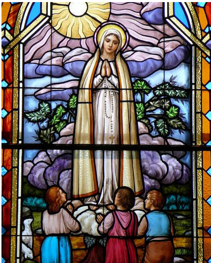
NOTRE-DAME DE FATIMA

Gloire au Père ... ; Ô mon Jésus ... ; Saint Michel Archange, défendez-nous dans le combat ; soyez notre protecteur contre la malice et les embûches du démon. Que Dieu lui fasse sentir son empire, nous vous en supplions. Et vous, Prince de la milice céleste, repoussez en enfer par la force divine, Satan et les autres esprits mauvais, qui rôdent dans le monde pour perdre les âmes. Ainsi-soit-il.