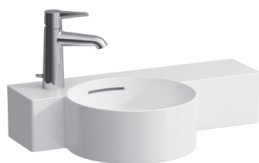
H815283 mit Ablage rechts