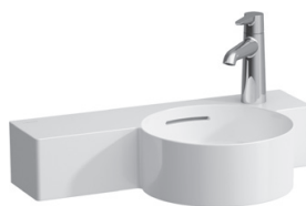
H815284 mit Ablage links

Asymmetrisch auf Maß 550 mm im 90° Winkel geschnitten für exakten Einbau, siehe unten