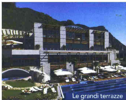
Le grandi terrazze