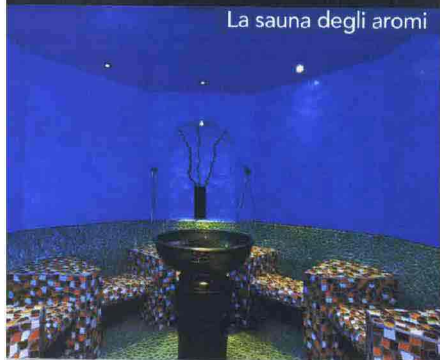
La sauna degli aromi

Nella zona Acqua e Fuoco ci sono grotte, piscine con acqua salina e vari tipi di saune, dalla Caligo simile a un bagno turco con il 98 per cento di umidità alla sauna degli aromi, più leggera, secca e aromatizzata agli oli essenziali.