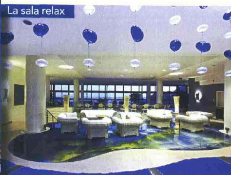
La sala relax