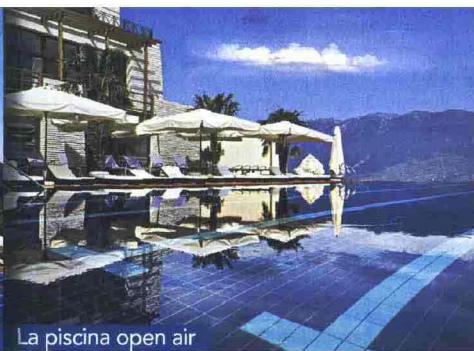
La piscina open air