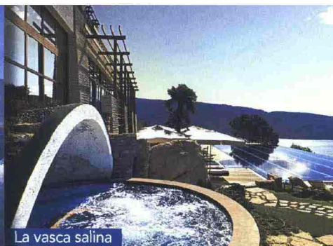
La vasca salina