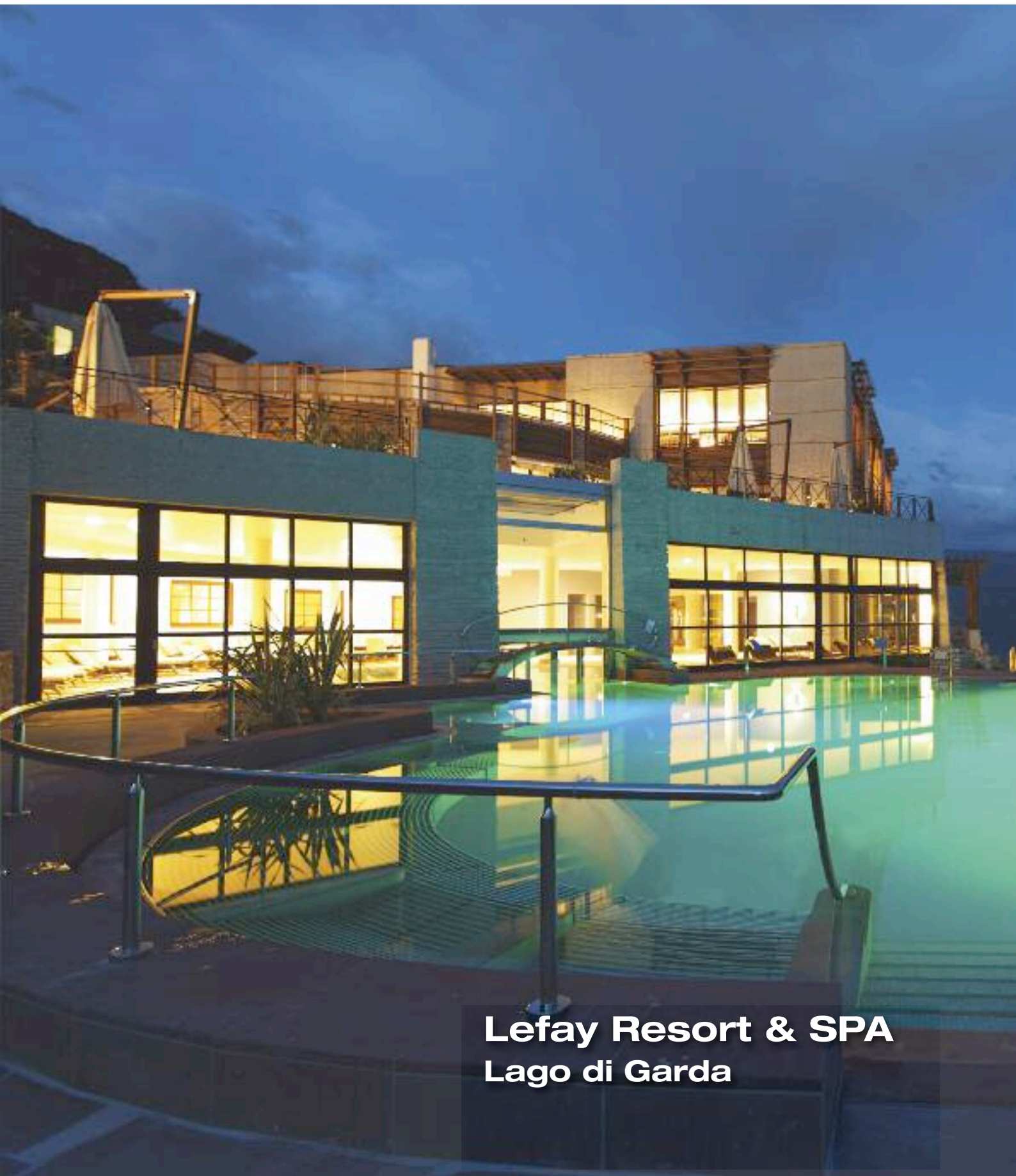
Lefay Resort & SPA Lago di Garda