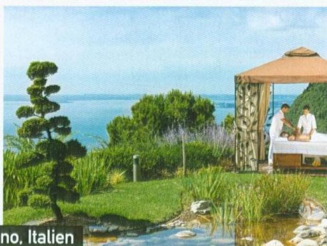
Lefay in Gargnano, Italien