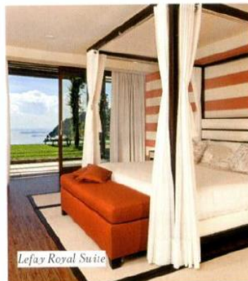
Lefay Royal Suite