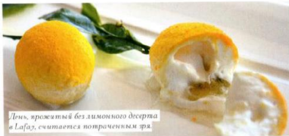
День, прожитый без лимонного десерта в Lefay, считается потраченным зря.