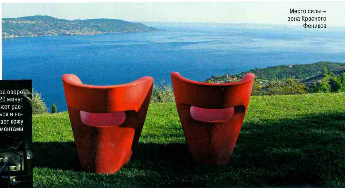
Место силы – зона Красного Феникса

Соляное озеро всего за 20 минут поможет расслабиться и напитает кожу микроэлементами