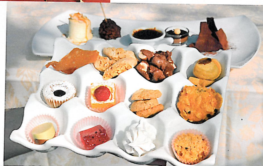
Verlockend ist die Auswahl der Patisserie im Restaurant „Quintessenza“ in Moniga del Garda. Die süßen Köstlichkeiten reichen vom knusprigen Gebäck bis zum Schokoladentörtchen (l.)