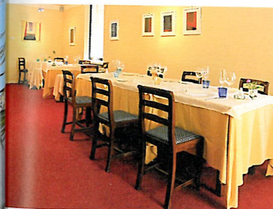
Erst 2001 gegründet wurde das Weingut La Perla del Gard in Lonato am Südufer des Sees mit seinem Degustationsraum (u.) und der Sammlung von historischen Motorzweirädern (r.)