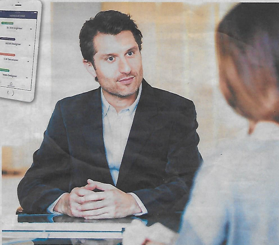
Si le candidat qu'il a recommandé est embauché, l'utilisateur de Linkeys ou «linker» touche une prime.