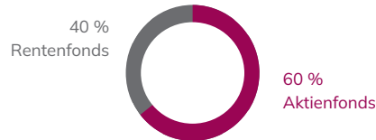
PORTFOLIO ZUM ZEITPUNKT B

Aufteilung des Fondsguthabens hat sich zu Gunsten einer Anlageform verschoben.