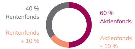
PORTFOLIO NACH REBALANCING

Wir kaufen günstig die schwächere Anlageform nach und sorgen so wieder für Ihre gewünschte Aufteilung.