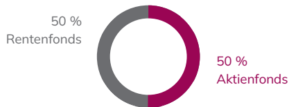
PORTFOLIO ZUM ZEITPUNKT A

Aufteilung Ihres Anlagebeitrags: 50 % in Aktien- und 50 % in Rentenfonds