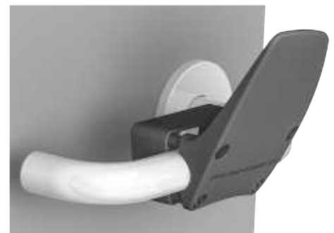
PULSIVA Handtag Hands free 7.1x10.5x7.8 cm (BxHxD) FT30089413 128,00 s. 755