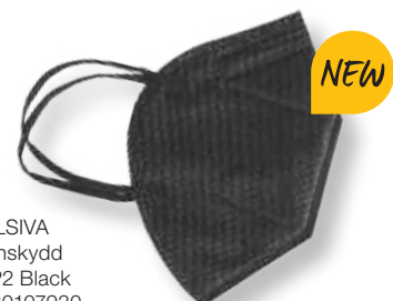
PULSIVA Munskydd FFP2 Black FT30107930 15,50 s. 756