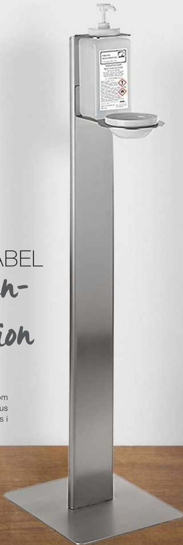
Hygienstation Easy s. 754

LUSINI erbjuder många praktiska hygienprodukter som skyddar mot att virus och bakterier sprids i dina lokaler.