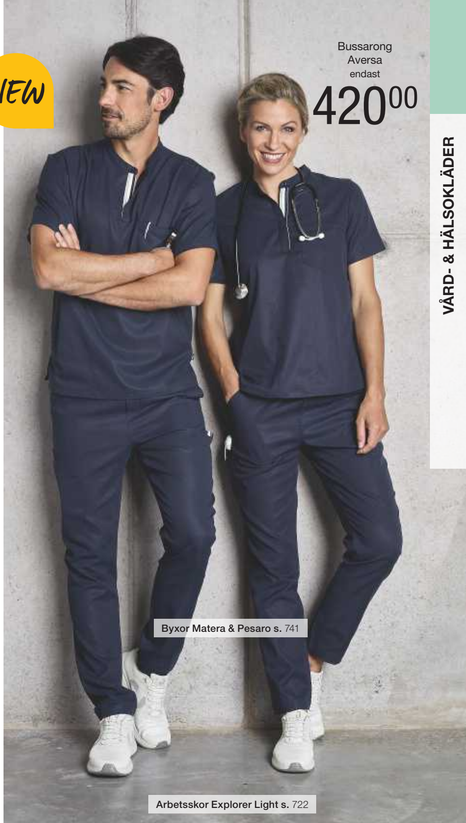
Byxor Matera & Pesaro s. 741