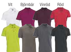
Äppelgrön Gråbrun Grafit Svart