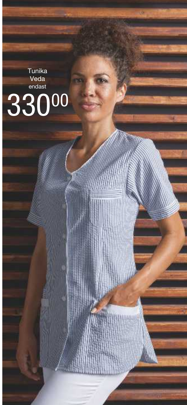
Tunika Veda endast