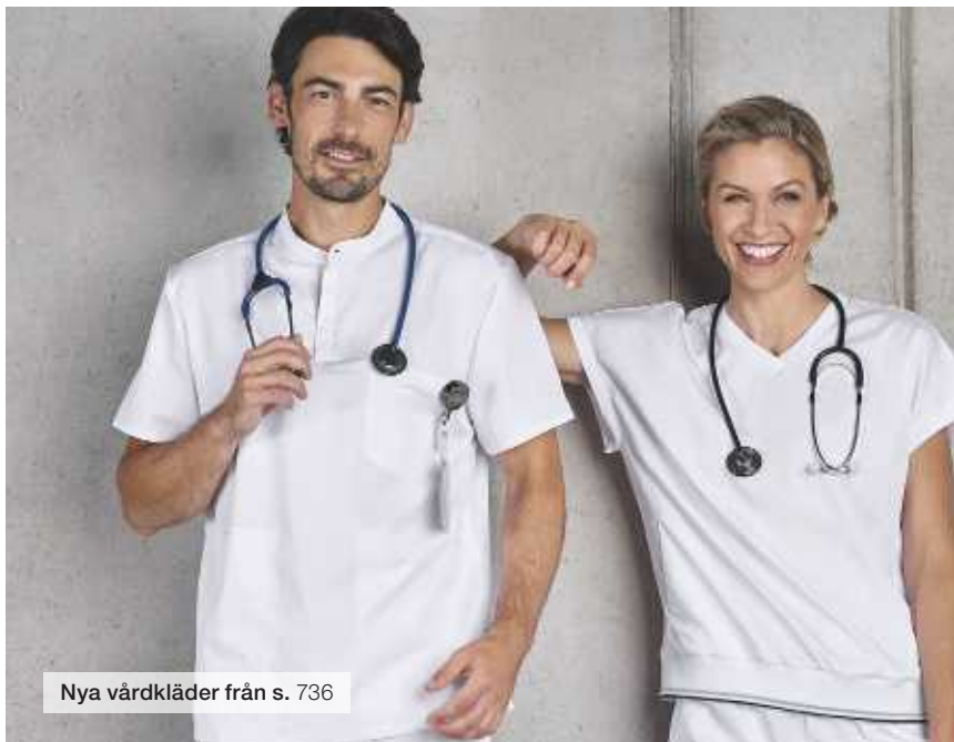
Nya vårdkläder från s. 736

Med vår nya kollektion av vårdkläder är du och ditt team välutrustade för yrkets utmaningar.