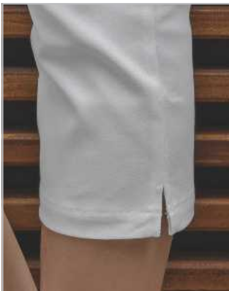
■ Capribyxor med slits