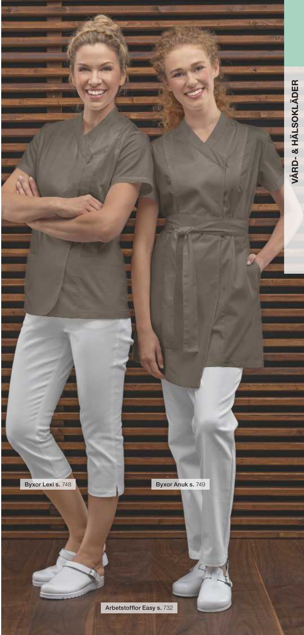
Byxor Lexi s. 748