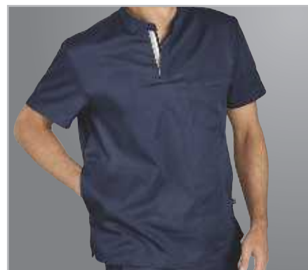
■ Två stora fickor