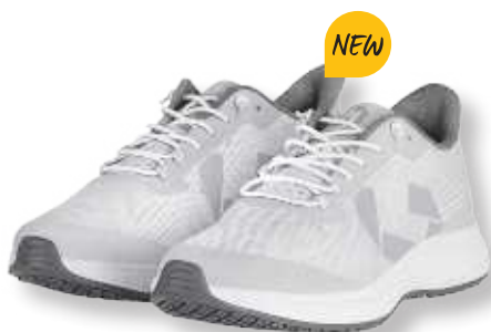
JOBELINE Arbetskor Explorer Light FT30109806 690,00 s. 722