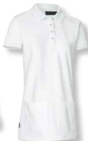
JOBELINE Pikétröja dam Cato comfort FT30034540 340,00 s. 746