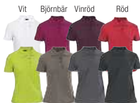
Äppelgrön Gråbrun Grafit Svart