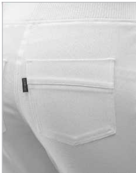
■ Med 2 bakfickor