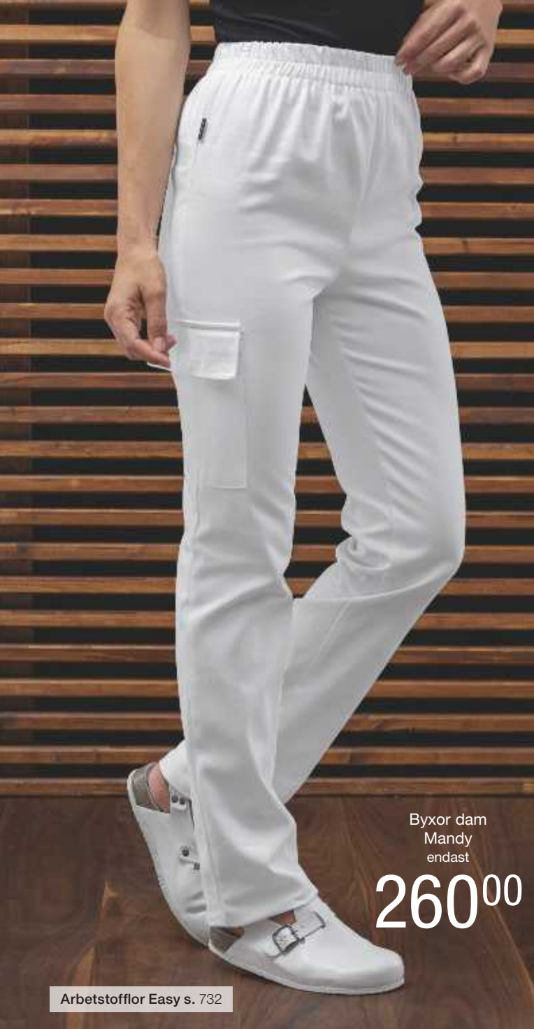
Byxor dam Mandy endast