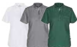
Vit Grå Grön