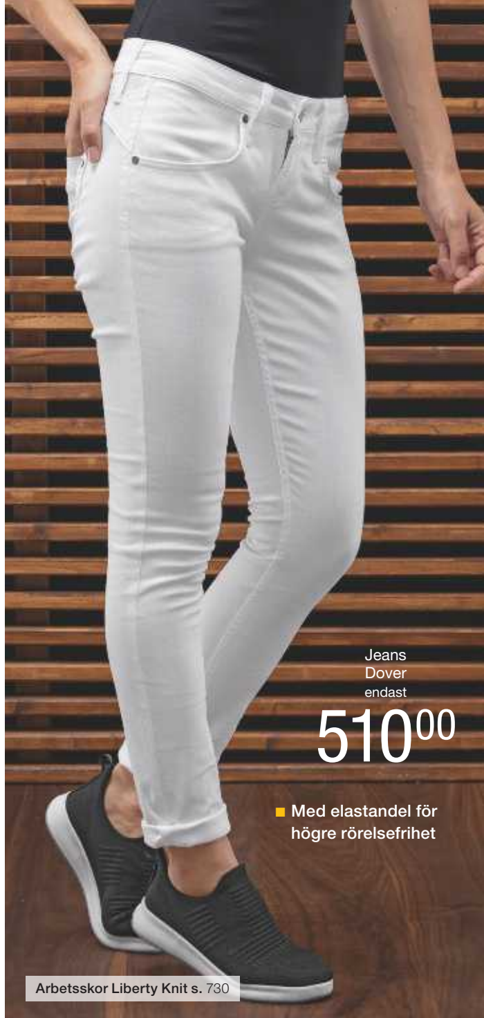
Jeans Dover endast