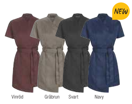
Vinröd Gråbrun Svart Navy