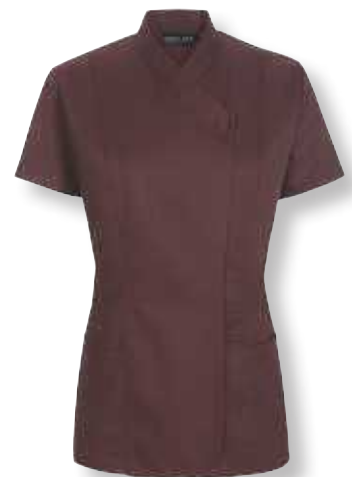
JOBELINE Bussarong Maila FT30046845 310,00 s. 743