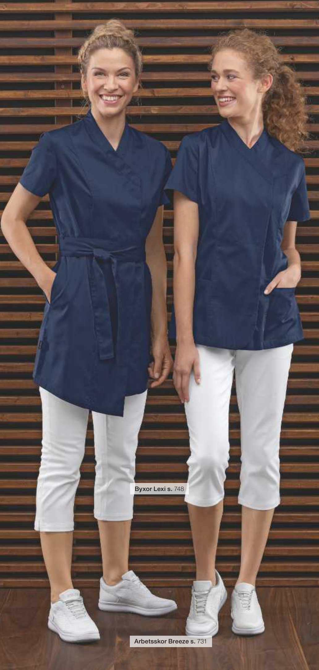
Byxor Lexi s. 748