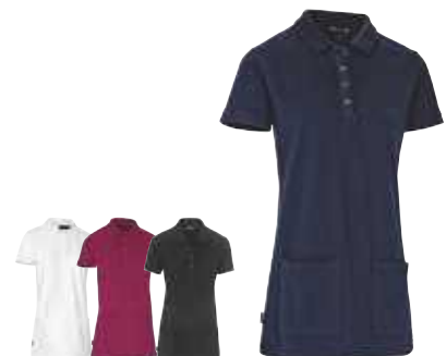
Vit Björnbär Svart Navy