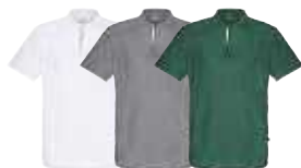
Vit Grå Grön