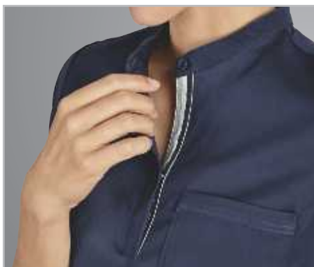
■ Modern krage