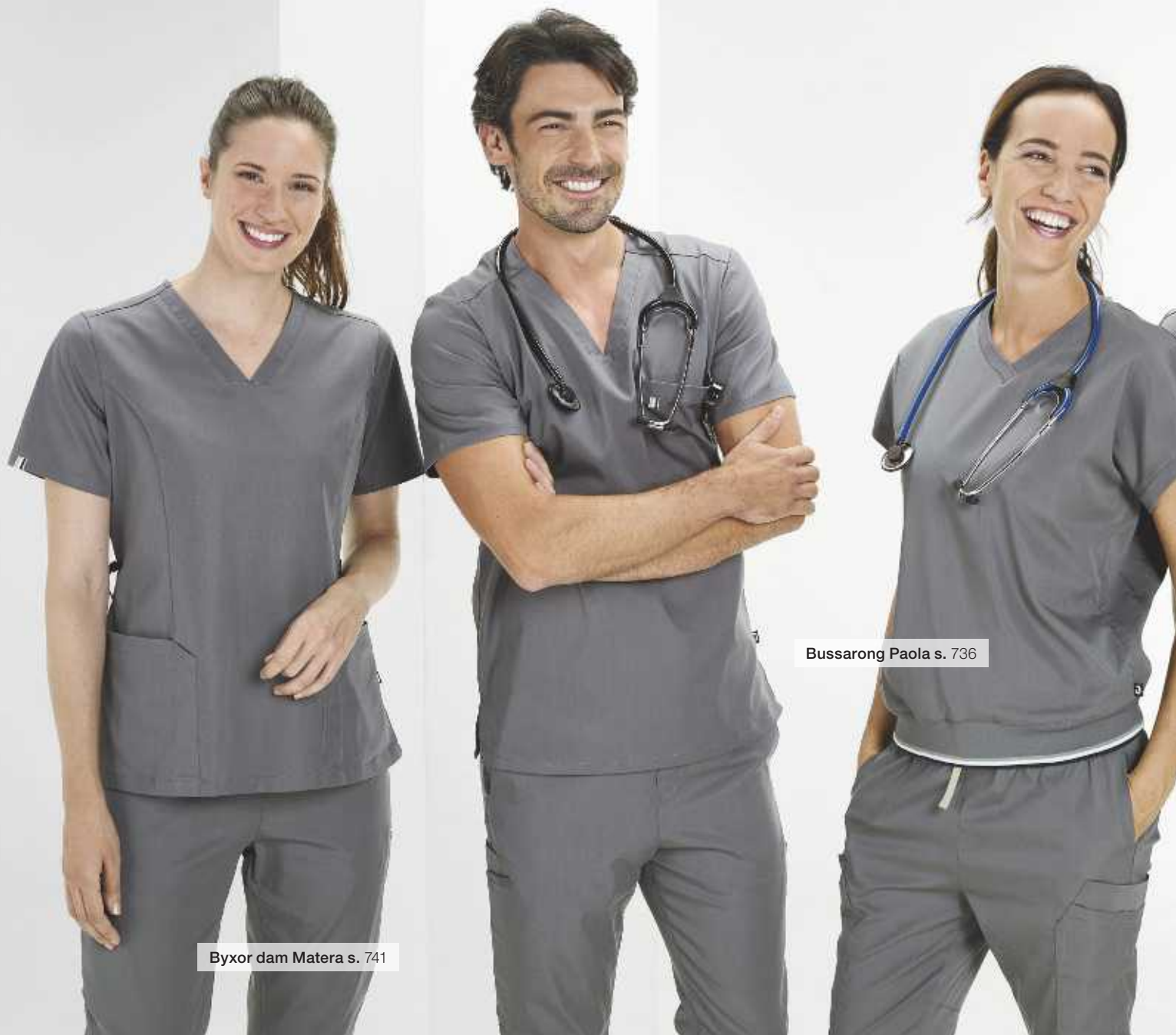
Byxor dam Matera s. 741