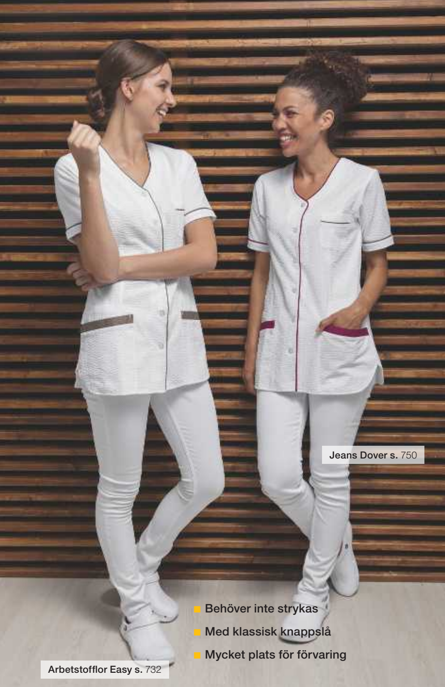
Jeans Dover s. 750