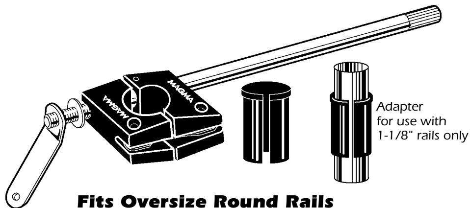
Adapter for use with 1-1/8" rails only