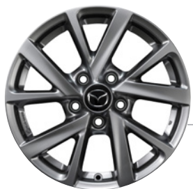
16-Zoll Mazda Original Leichtmetallfelgen in Silber mit 215/65 R16 Bereifung