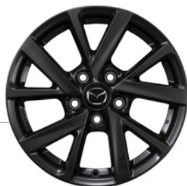
16-Zoll Mazda Original Leichtmetallfelgen in Anthrazit mit 215/65 R16 Bereifung