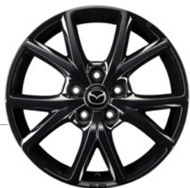
17-Zoll Mazda Original Leichtmetallfelgen in Schwarz glänzend mit 215/60 R17 Bereifung