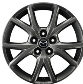
17-Zoll Mazda Original Leichtmetallfelgen in Titangrau mit 215/60 R17 Bereifung