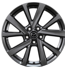
18-Zoll Mazda Original Leichtmetallfelgen in Chrome Shadow mit 215/55 R18 Bereifung