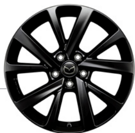
18-Zoll Mazda Original Leichtmetallfelgen in Schwarz glänzend mit 215/55 R18 Bereifung