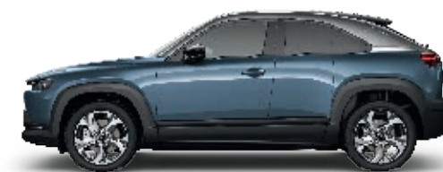
3-TON-LACKIERUNG: POLYMETAL GRAU METALLIC (47L)* FENSTERRAHMEN IN SILBER, DACHLACKIERUNG IN SCHWARZ