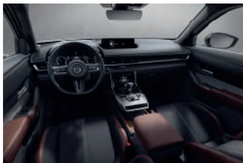
Innenraumkonzept Industrial Vintage