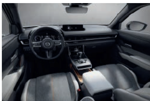
Innenraumkonzept Modern Confidence