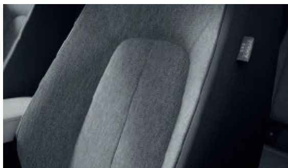
Sitzbezüge aus Stoff, schwarz/Melange-Stoff, grau