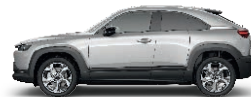
MONDSTEINWEISS METALLIC (47A)