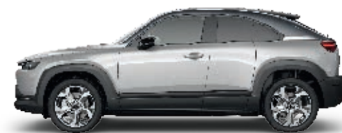
3-TON-LACKIERUNG: MONDSTEINWEISS METALLIC (48A)* FENSTERRAHMEN IN GRAU, DACHLACKIERUNG IN SCHWARZ