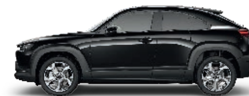
ONYXSCHWARZ METALLIC (41W)