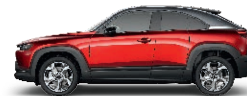
3-TON-LACKIERUNG: MAGMAROT METALLIC (47E)* FENSTERRAHMEN IN GRAU, DACHLACKIERUNG IN SCHWARZ