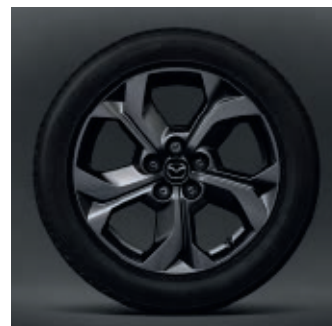
18-Zoll-Leichtmetallfelgen in Silbergrau mit Hochglanzfinish