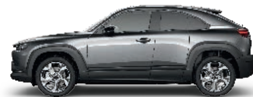
MATRIXGRAU METALLIC (46G)*