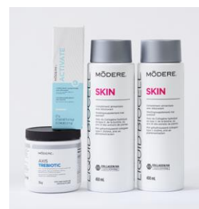
Axis Digestive Duo + Skin Punkty: 200

Darmowy pakiet akcesoriów -10% zniżki na całe zamówienie! €50 do wydania!*