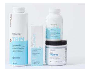
BodyTransformation System – Chocolate lub Mango + Axis Trebiotic Punkty: 200

Darmowy pakiet akcesoriów -10% zniżki na całe zamówienie! €50 do wydania!*