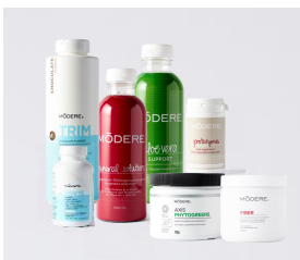
5 Day Cleanse + BTS – Chocolate lub Mango Punkty: 200

Darmowy pakiet akcesoriów -10% zniżki na całe zamówienie! €50 do wydania!*