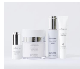
CellProof Essentials Punkty: 150

Darmowy pakiet akcesoriów -10% zniżki na całe zamówienie! €50 do wydania!*