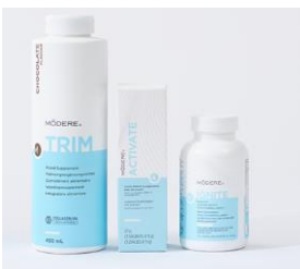
Body Transformation Basic Chocolate lub Mango Punkty: 150

Darmowy pakiet akcesoriów -10% zniżki na całe zamówienie! €50 do wydania!*