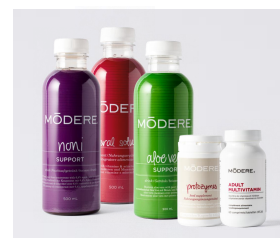
Basic Nutrition Solutions Selection Punkty: 150

Darmowy pakiet akcesoriów -10% zniżki na całe zamówienie! €50 do wydania!*