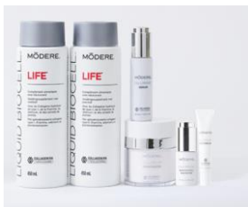
Inside-Out Life lub Skin Punkty: 200