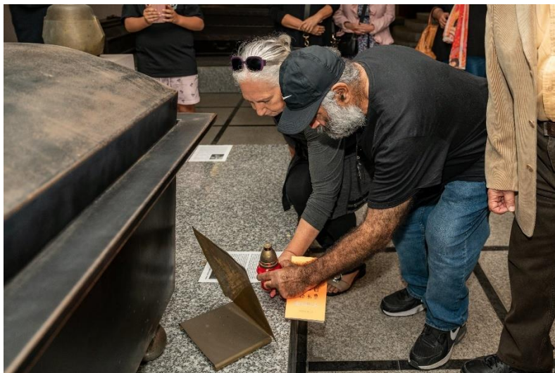
W Krypcie Zasłużonych Wielkopolan - znicze w hołdzie P.E. Strzeleckiemu.