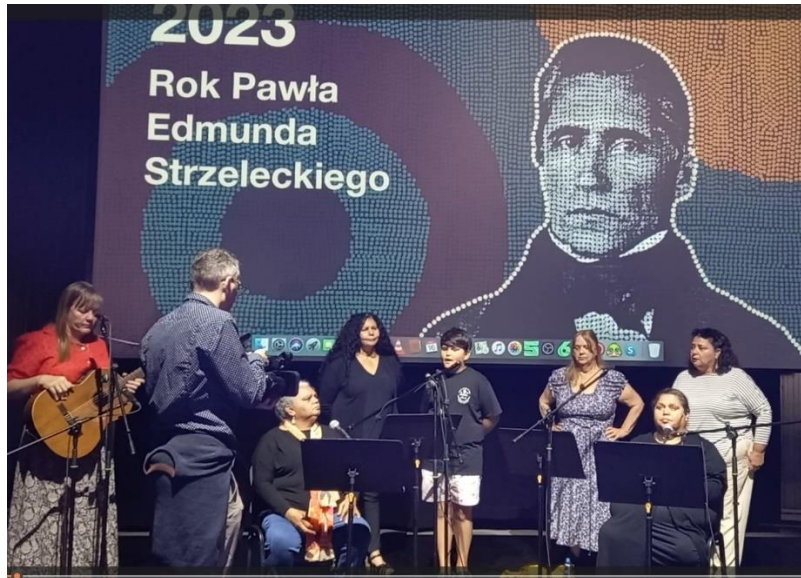
Poznański PAWILON. Bardzo nam przypadła do gustu scenografia z nader ciekawym elementem graficznym.