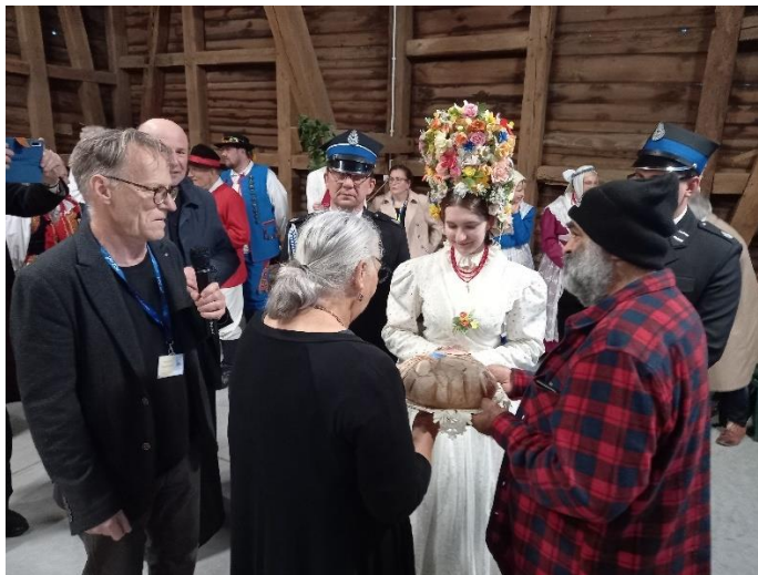
Głuszyna, powitanie delegacji Tradycyjnych Kustoszy z polską serdecznością: chlebem i solą.