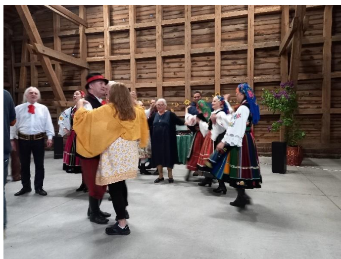
Głuszyna - wspólne tańce. Strzelecki i Kościuszko łączą zarówno Monero-Ngarigo jak i Polaków z Górą Kościuszki.