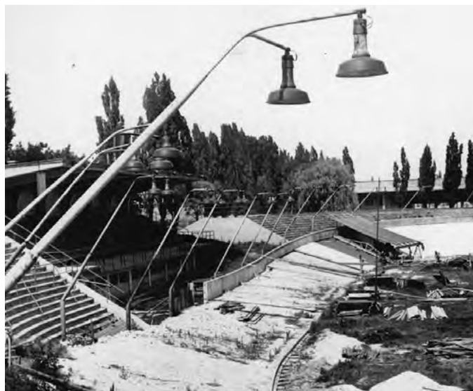
Rekonštrukcia cyklistickej dráhy 1965