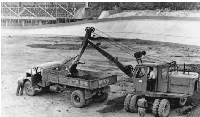
Rekonštrukcia hracej plochy 1958

Určitá stagnácia našej dráhovej cyklistiky nastala po roku 1958, keď vtedajší vlastník dráhy Lokomotíva Bratislava začala s prestavbou futbalového ihriska a cyklistická dráha, ktorá obkolesovala trávnik, začala chátrať. Bol to negatívny zásah do tréningov i pretekov, ubudlo aj divácke zázemie. Úspešnejšie zakročil až nový majiteľ – Správa telovýchovných zariadení pri KV ČSTV Západoslovenského kraja, ktorá pristúpila k rekonštrukcii celej klopenej dráhy, ktorá bola aj s pomocou TJ Slovnafť Bratislava, k radosti cyklistov, dokončená v roku 1965. V ďalších rokoch či desaťročiach na nej vyrástla, trénovala i pretekala celá plejáda výborných cyklistov a reprezentantov na čele s olympijským víťazom a trojnásobným majstrom