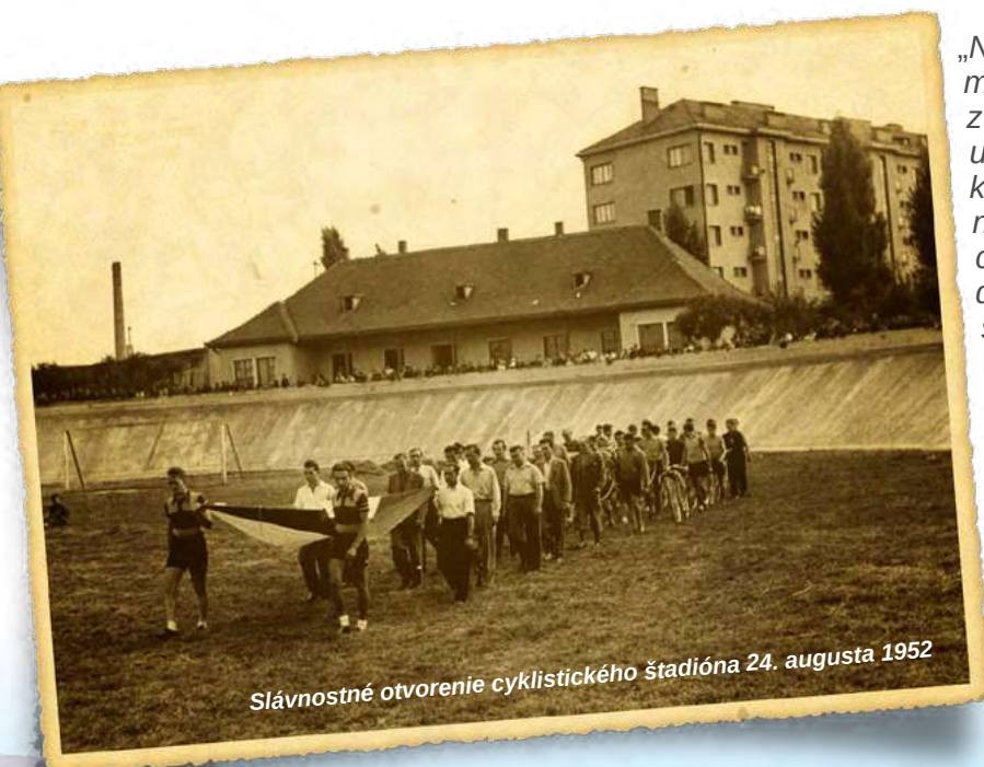
Slávnostné otvorenie cyklistického štadióna 24. augusta 1952

„Na cyklistický štadión Slovana Bratislava sa možno dostať dvoma cestami. Buď sa vyberiete z Centrálného trhoviska rovno po Vajnorskej ulici a po vari štyristo metroch zabočíte okolo klubového hotela Slovana doprava, alebo k nemu prídete z druhej strany po Trnavskej ceste a pred zimným štadiónom prejdete doľava na ulicu Odbojárov. Tam vedľa zimného štadióna, plaveckého bazéna a tenisových kurtov je prvá a jediná betónová dráha na Slovensku.“ Podľa tohto návodu Róberta Bakalára z knihy Zlatý expres z roku 1980 by ste sa dnes dostali do Jamy. Konkrétne do športparku Jama v bratislavskej mestskej časti Nové Mesto. Do príjemného prostredia plného kvetov, vodných rastlín, kríkov a stromov, určeného na oddych, rekreáciu a voľnočasové aktivity, naplnené