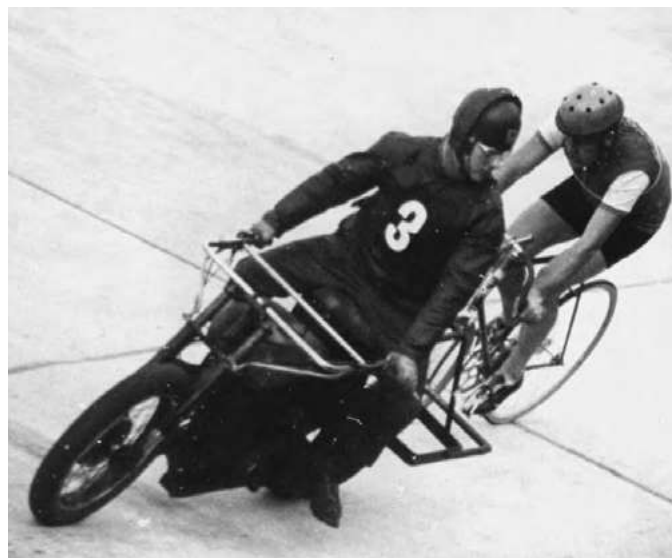
Jazda za motorovým vodičom na bratislavskej klopenej dráhe, 50. roky