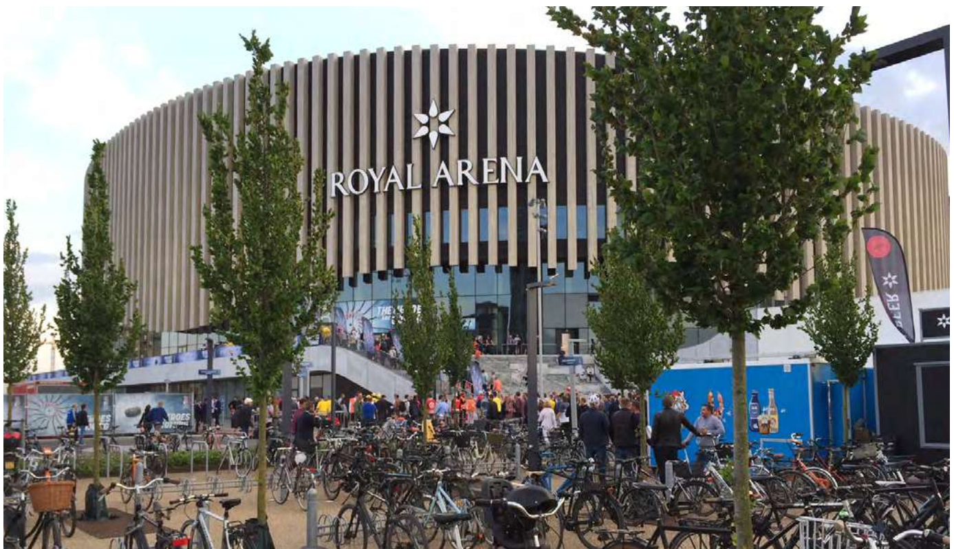
Royal Arena, Dánsko

Nórske samosprávy vlastnia asi polovicu športovísk a predstavujú najvýznamnejšieho aktéra v súvislosti s výstavbou a prevádzkou predovšetkým tých najväčších a najdrahších športových zariadení. Podobne ako vo Fínsku, aj tu sa štát snaží samosprávam finančne pomáhať prostredníctvom dotácií, pričom na to využíva zisky z lotérií. Ako vo svojej štúdii uvádza C. Öhman, ešte v roku 1992 nórsky parlament rozhodol, že zisky zo stávkovania a lotérií, ktoré administruje ministerstvo kultúry, sa majú použiť iba na kultúrne, športové a výskumné účely. Od roku 2005 sa tieto financie dajú používať už len pre kultúrne a športové projekty. Ministerstvo kultúry distribuuje zisky z lotérií na športové účely raz ročne, pričom podstatná časť týchto zdrojov sa používa práve na športovú infraštruktúru. V roku 2015 to bola suma 1 058 977 000 nórskeho korún (asi 111 miliónov eur), ktorú ministerstvo alokovalo špecificky na finančnú podporu športových zariadení samospráv. Tá predstavovala takmer 47% zo ziskov z lotérií určených na šport. Ďalších 6% alebo 136 577 000 nórskeho korún (14,3 milióna eur) sa použilo na iné projekty športovej infraštruktúry. Tieto prostriedky sú dostupné pre miestne samosprávy, športové kluby a organizácie zriadené samosprávami.