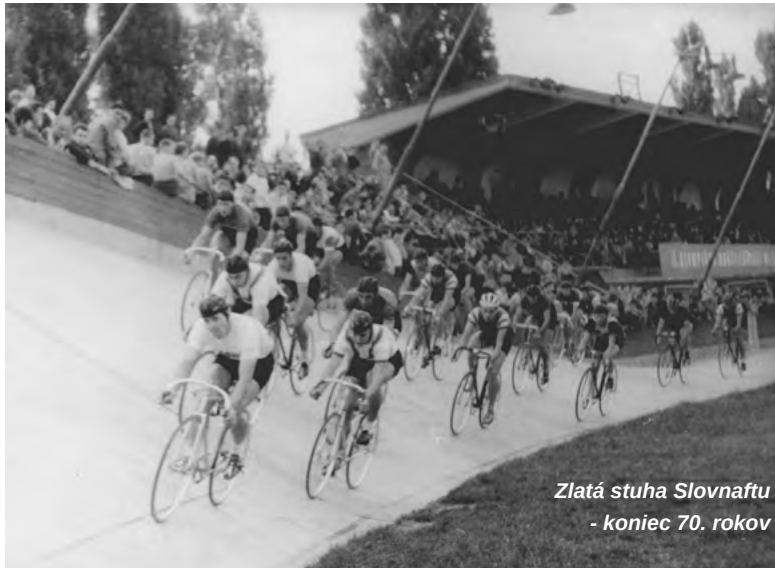
Zlatá stuha Slovaftu - koniec 70. rokov