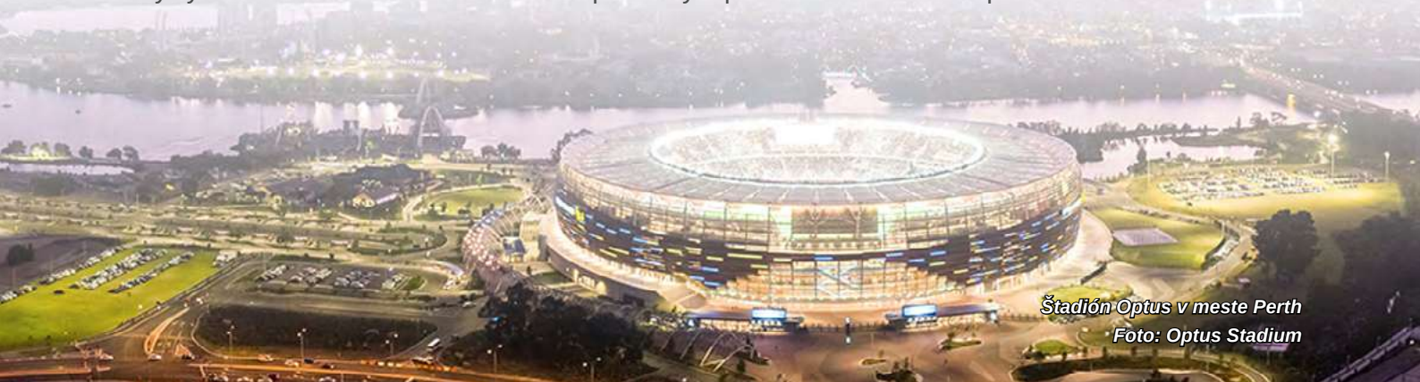
Štadión Optus v meste Perth

Nečudoval by som sa, keby štadión v Londýne čakal o pár rokov podobný osud. Futbalisti West Hamu sa už druhý rok od presťahovania do nového pôsobiska výsledkovo trápia a fanúšikovia sa sťažujú, že je miestom bez duše. Hráči i diváci sa na ňom cítia úplne stratení. Pri pohľade na ihrisko zo 73. radu máte totiž dojem, že sa pozeráte cez nesprávnu stranu ďalekohľadu. Londýnsky štadión je však dnes všeobecne považovaný za pozitívny príklad olympijského dedičstva. Je na individuálnom posúdení každého či oprávnene.