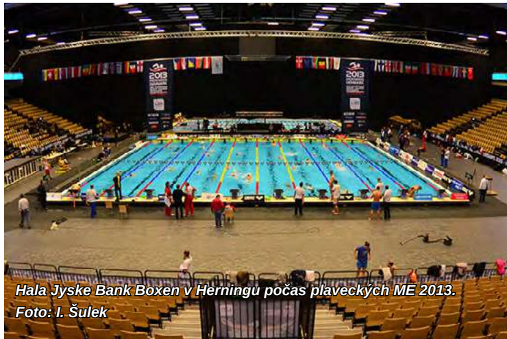
Hala Jyske Bank Boxen v Herningu počas plaveckých ME 2013.

Na to, aby mal kto na týchto podujatiach Slovensko reprezentovať, sú však potrebné podmienky vyhovujúce požiadavkám vrcholového tréningu. Vyššie spomenuté zahraničné príklady z Austrálie, Veľkej Británie či Dánska ukazujú, že medailové úspechy sa dajú dosahovať z pohľadu počtu bazénov v podmienkach diametrálne odlišných. Tie slovenské sa, žiaľ, ani jednému z týchto troch príkladov nepribližujú.