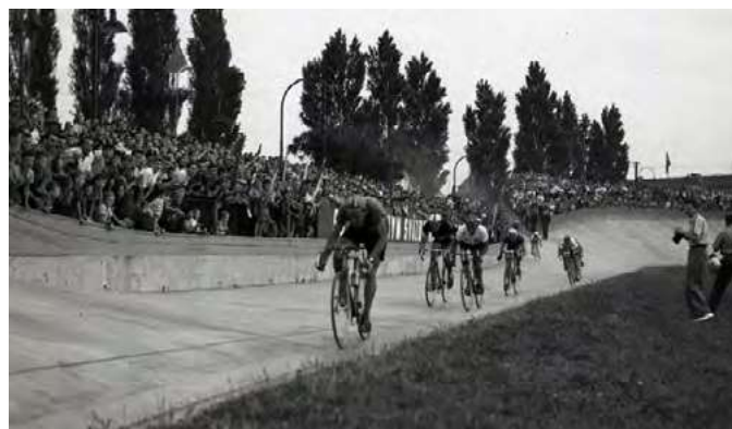
V poslednej etape I. ročníka Pretekov mieru 1954 na cyklistickom štadióne na ulici Odbojárov v Bratislave

Klopená dráha na Národnom cyklistickom štadióne Vlastimila Ružičku dokázala slúžiť cyklistom po spomínanej rekonštrukcii v roku 1965 ešte viac ako štyridsať rokov, keď tá úplne posledná rekonštrukcia prebehla v roku 1996. Šesťdesiatky sa už klopená dráha nedožila. Možno by stálo zato, umiestniť do Jamy malú informačnú tabuľku o tom, čo tu bolo pred Jamou.