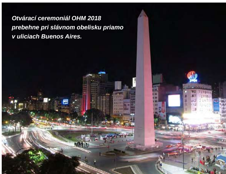
Otvárací ceremoniál OHM 2018 prebehne pri slávnom obelisku priamo v uliciach Buenos Aires.

manažment, výživa, environmentálna zodpovednosť, mediálny tréning či etika. Účastníci hier sa tak stávajú ambasádormi športu a olympizmu vo svojich krajinách i propagátormi zdravého životného štýlu. Jedným z najúčinnejších prostriedkov ako vychovávať mladých športovcov sa údajne ukázali byť stretnutia pod názvom „Chat with Champions“, ktoré majú podobu diskusií mladých účastníkov s úspešnými olympionikmi. Počas doterajších vydaní hier mládeže sa takýmto spôsobom o svoje skúsenosti podelili