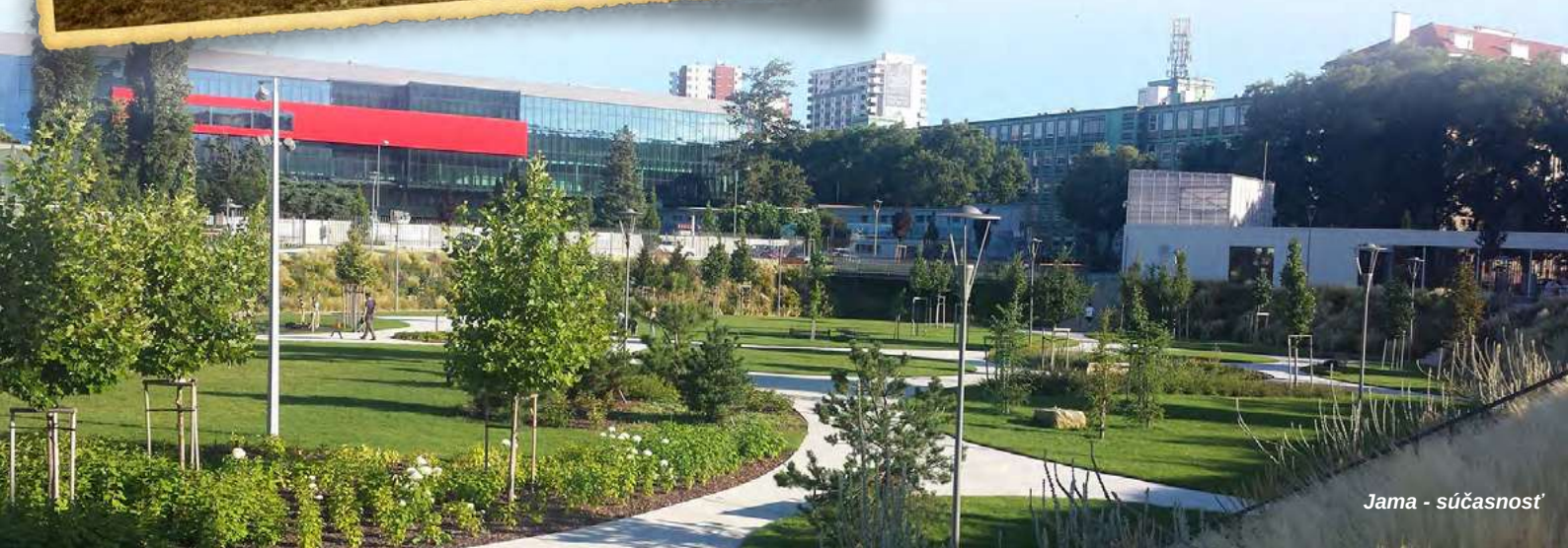
Jama - súčasnosť