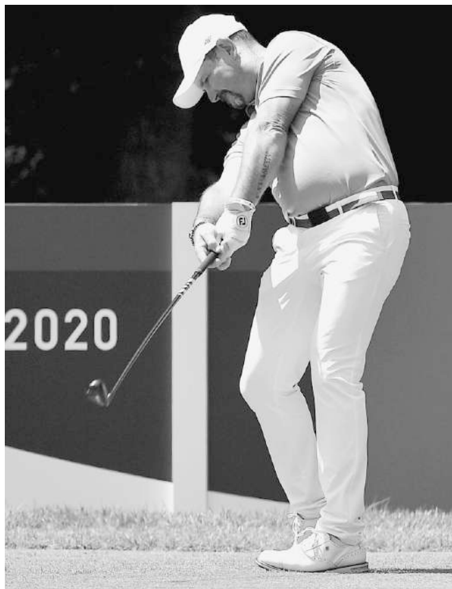
Pri premiére slovenského golfu na olympijských hrách získal Rory Sabbatini striebornú medailu.

● MUŽI : 1. Schauffele (USA) 266, 2. Sabbatini (SR) 267, 3. Pchan Čcheng-cung (Taiw.) 269.