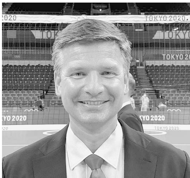
Slovenský rozhodca Juraj Mokřý rozhodoval olympijské volejbalové finále.