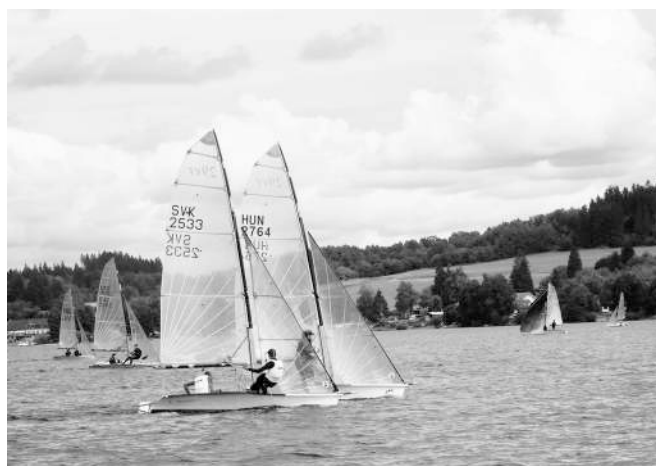
Jachtári napriek pandémie dokázali odjazdiť takmer celú sezónu.

★ RS:X: 1. Badloe (Hol.), 2. Goyard (Fr.), 3. Kchun Pchi (Čína).