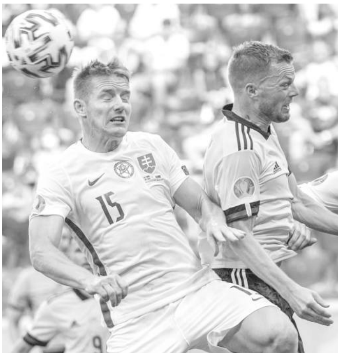
Slovenskí futbalisti nechýbali na záverečnom turnaji majstrovstiev Európy, na ktorých nepostúpili zo základnej skupiny.

Kane, Sterling, Rashford, Trippier, Phillips, Mings, Coady, Sancho, Calvert-Lewin, Mount, Foden, Chilwell, White, James, Saka, Bellingham).