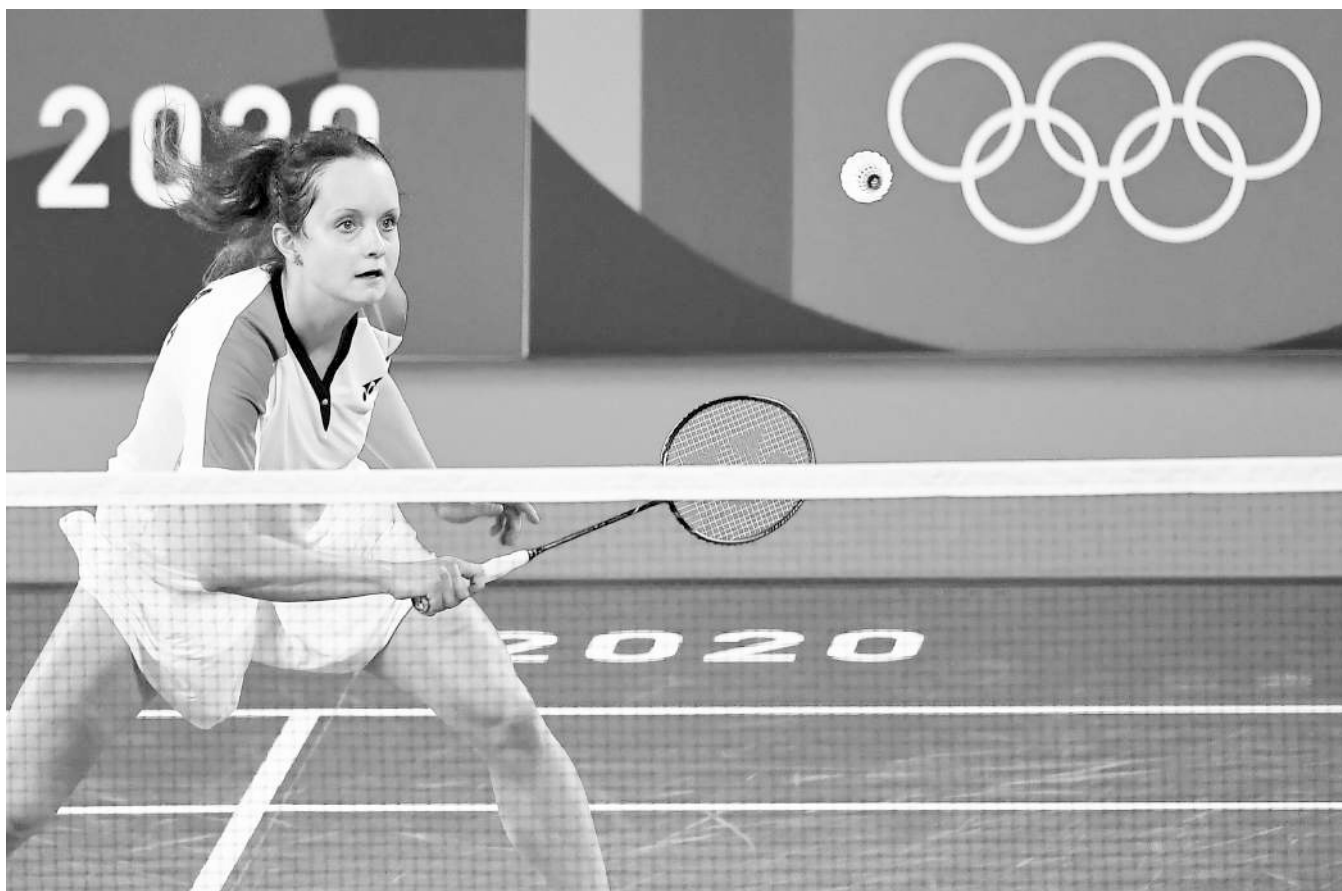
Martina Repiská sa stala prvou Slovenkou, ktorá vyhrala zápas v bedmintonne na olympijských hrách.