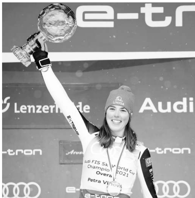
Petra Vlhová sa stala celkovou víťazkou Svetového pohára 2020/2021.