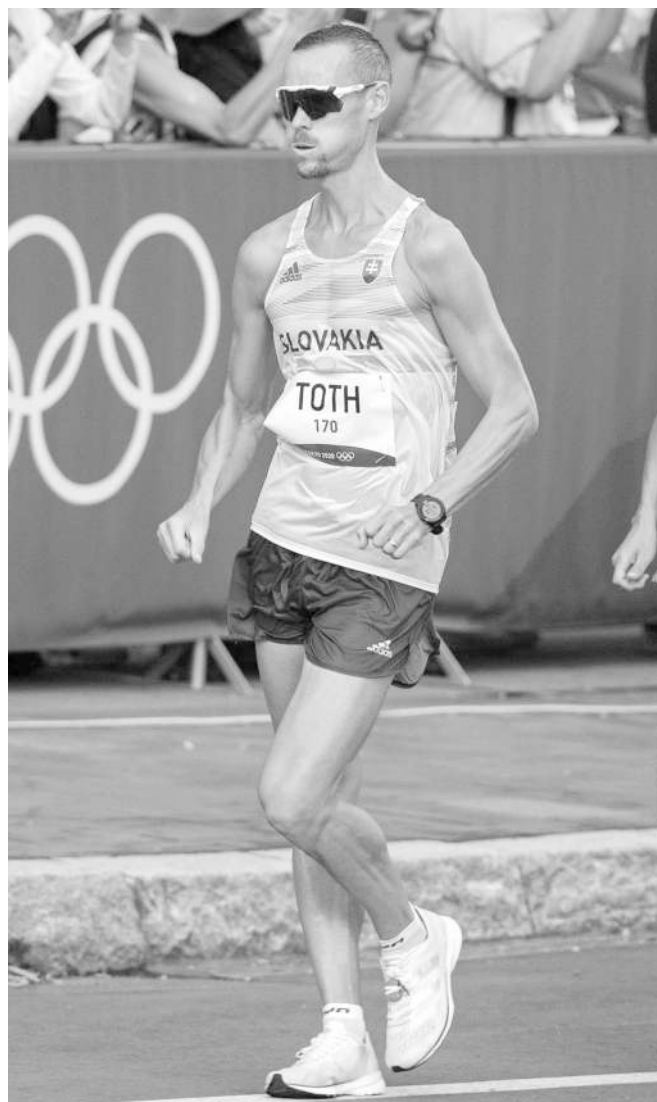
Matej Tóth počas olympijských pretekov na 50 km v Sappore, na ktorých sa lúčil s kariérou.

● ŽENY – 100 m: 1. Thompsonová-Herahová 10,61, 2. Fraserová-Pryceová 10,74, 3. S. Jacksonová (všetky Jam.) 10,76.