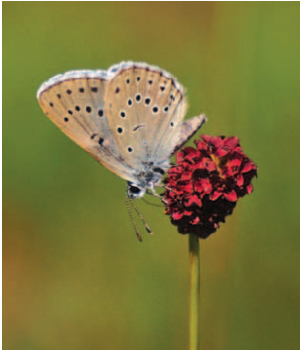
Pimpernelblauwtje op bloeiende grote pimpernel.