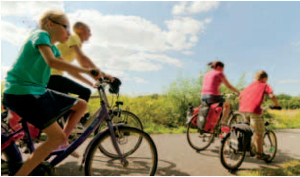
Wandelen, fietsen en hardlopen worden leuker en avontuurlijker.

De natuurgebieden het Vlijmens Ven en de Moerputten zijn onderdeel van het Europese natuurnetwerk Natura 2000 en ons Nationaal Natuur Netwerk. Daarom worden de projectkosten van ruim drie miljoen euro ook grotendeels gedragen door het Europese LIFE+ Nature-fonds en Provincie Noord-Brabant. Ook de gemeente Heusden, Staatsbosbeheer, Natuurmonumenten, De Vlinderstichting en waterschap Aa en Maas dragen bij.