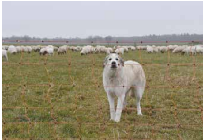
Schrikdraad en kuddewaakhonden vormen samen de beste preventie

Zoals gezegd zijn wolven gespecialiseerd in het eten van hoefdieren zoals ree en wild zwijn. Maar ze maken in principe geen onderscheid tussen wilde dieren en gehouden dieren zoals schapen en geiten. Daarom zijn maatregelen nodig om met name schapen te beschermen tegen aanvallen van wolven. Kuddes paarden en runderen worden minder bedreigd vanwege hun grootte en verdedigende houding.