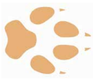
Perfekte-stap tred: de wolf zet zijn achterpoot in de afdruk van de voorpoot