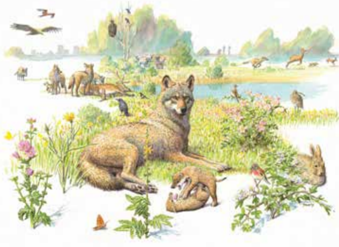
Wolven leven meestal in roedels

In ieder gebied kan slechts een beperkt aantal wolven leven. Elke roedel verdedigt zijn territorium tegen andere wolven. Een territorium in Midden Europa is meestal 200 tot 300 km 2 groot, maar soms worden territoria van slechts 50 km 2 in zeer voedselrijke gebieden aangetroffen. De grootte van een roedel bestaat meestal uit vijf tot tien dieren.