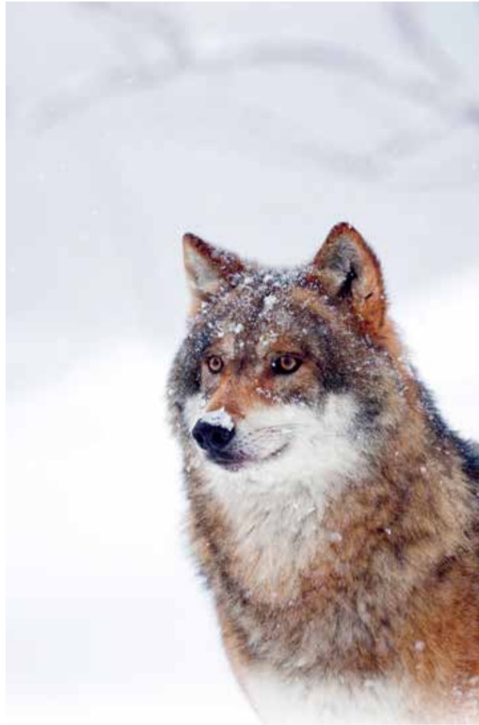
Wolven gedijen in verschillende landschappen

Wolven jagen vooral op dieren die makkelijk te vangen zijn, zoals jonge onervaren dieren en oud of zwak wild. Dieren met een snel reactievermogen en een goede gezondheid worden minder vaak gedood. De aanwezigheid van wolven houdt hun prooidieren in beweging met als gevolg dat ze minder op voorspelbare plekken en op voorspelbare tijden aanwezig zijn. Dit werkt door in het gebied waar ze leven. Op plekken waar de grazers minder komen krijgt spontane bosverjonging meer kans. Wat de effecten in Nederland precies zullen zijn, zal de tijd leren.