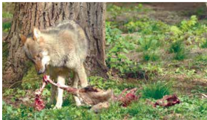
Wolven doden om de paar dagen een wild hoefdier

Wolven die zich gevestigd hebben jagen vooral op grote wilde hoefdieren, zoals ree, damhert, edelhert en wild zwijn. Wolven hebben in de natuur een belangrijke rol als predator. Zo doden wolven om de paar dagen een wild hoefdier. De resten blijven in de natuur achter en vormen een voedselbron voor aaseters, zoals aaskevers, raaf en zeearend.