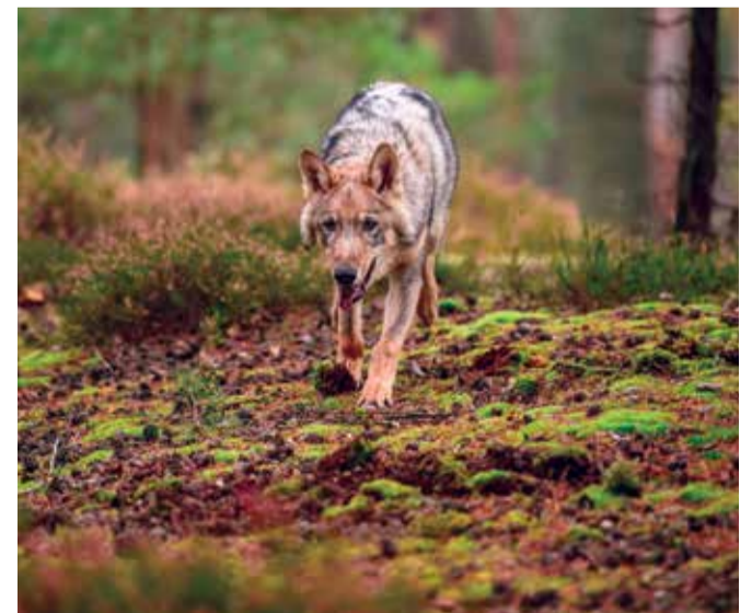
Rondzwervende jonge wolf op zoek naar eigen leefgebied

Sinds 2017 zijn er vrijwel continu wolven in Nederland aanwezig. Het zijn rondzwervende jonge wolven op zoek naar een eigen leefgebied en partner. Sinds het voorjaar van 2018 zijn er enkele solitaire dieren die langer in een regio verblijven. Wolven lijken dus ondanks bovenstaande bedreigingen in staat om langdurig in Nederland te overleven.