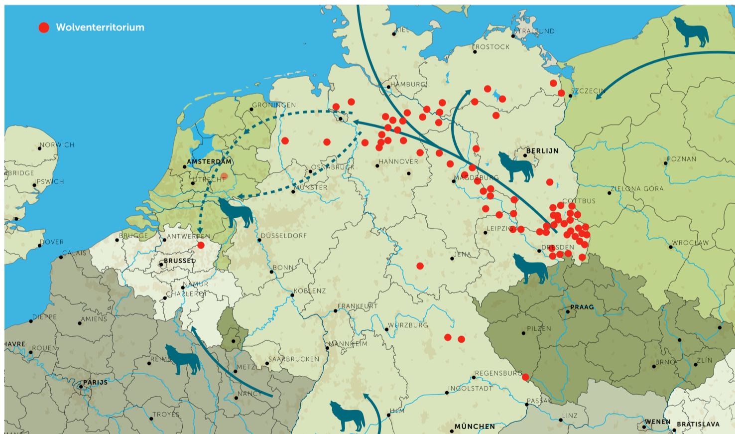
De verspreiding van wolvenroedels en wolventerritoria in onze buurlanden in 2018