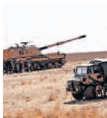
▲ Turkse militairen zitten bij hun voertuigen bij de Turks-Syrische grens.