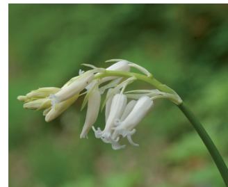
Wilde boshyacint Bloei: april-mei