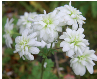
Haarlems klokkenspel Bloei: mei-juni