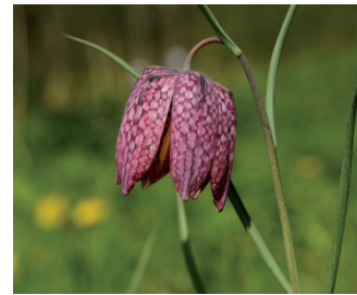
Kievitsbloem Bloei: april