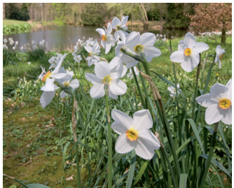
Dichtersnarcis Bloei: april-mei