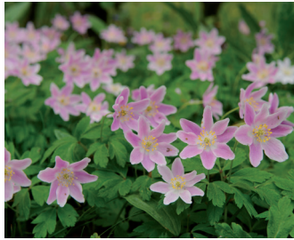
Bosanemoon Bloei: maart-eind april