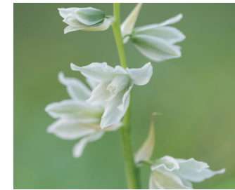
Knikkende vogelmelk Bloei: mei