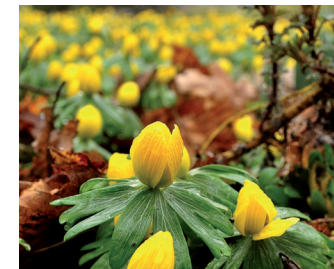
Winterakoniet Bloei: december-maart