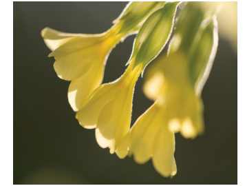
Slanke sleutelbloem Bloei: maart-april