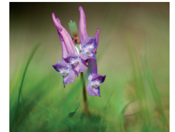
Vingerhelmbloem Bloei: maart-april