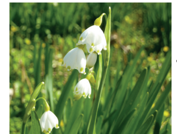
Zomerklokje Bloei: maart-mei