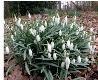
Sneeuwkllokje Bloei: februari-maart