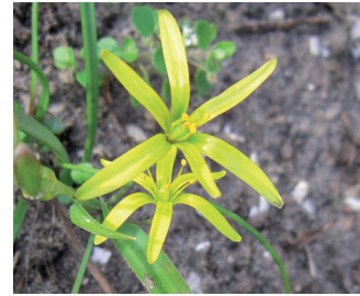
Weidegeelster Bloei: maart-april