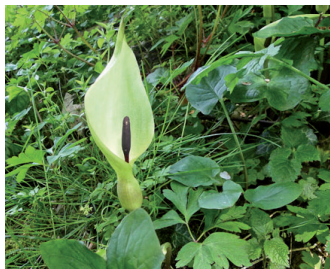
Italiaanse aronskelk Bloei: april-mei