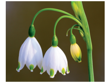
Lenteklokje Bloei: februari-maart