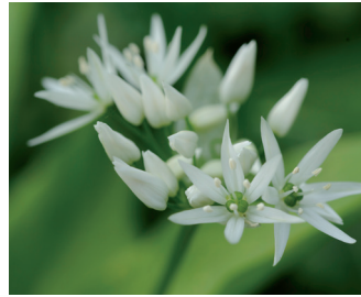
Daslook Bloei: april-juni