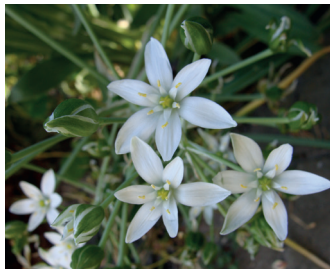
Gewone vogelmelk Bloei: april-mei