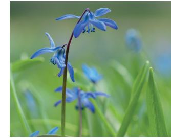
Oosterse sterhyacint Bloei: maart-april