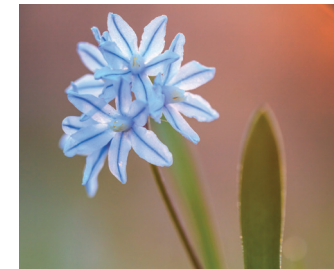
Buishyacint Bloei: maart-april