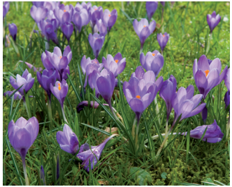
Bonte krokus Bloei: februari-april

Hieronder kun je aankruisen welke soorten je hebt gespot