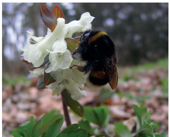
Holwortel Bloei: maart