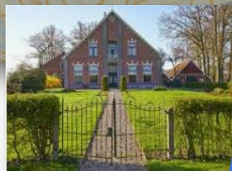
Bekendelle / Keunenuis