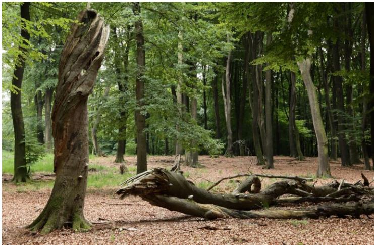
Natuur aan het werk: Stormschade bij een oude Beuk

Voor veel aangeplante dennenbossen geldt dat een slimme manier van dunning en regulering van de graasdruk de gewenste verjonging door loofhout vanzelf tot stand komt. Grote kapvlaktes zonder nazorg resulteren in uitspoeling van voedingsstoffen en vaak vestiging van opnieuw uitheemse naaldbomen. Een inheemse en wilde boom moet de kans krijgen spontaan te ontkiemen, te volgroeien en weer af te takelen om als voedsel en schuilplaats te dienen voor vele vormen van leven.