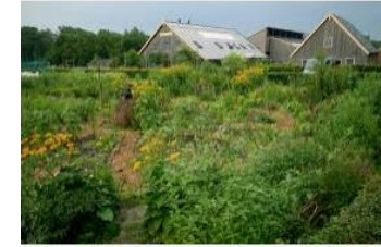
De grote Modderkolk