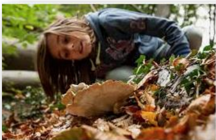
Bergherbos en de-bijvanck