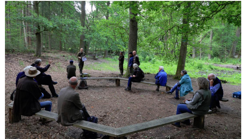
PCG NoordWest Veluwe in gesprek met de beheereenheid over bomenkap