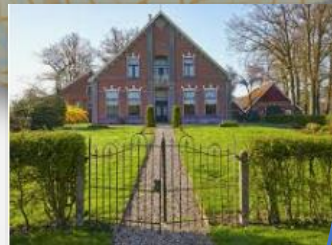
Bekendelle / Keunenuis