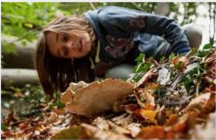
Bergherbos en de-bijvanck