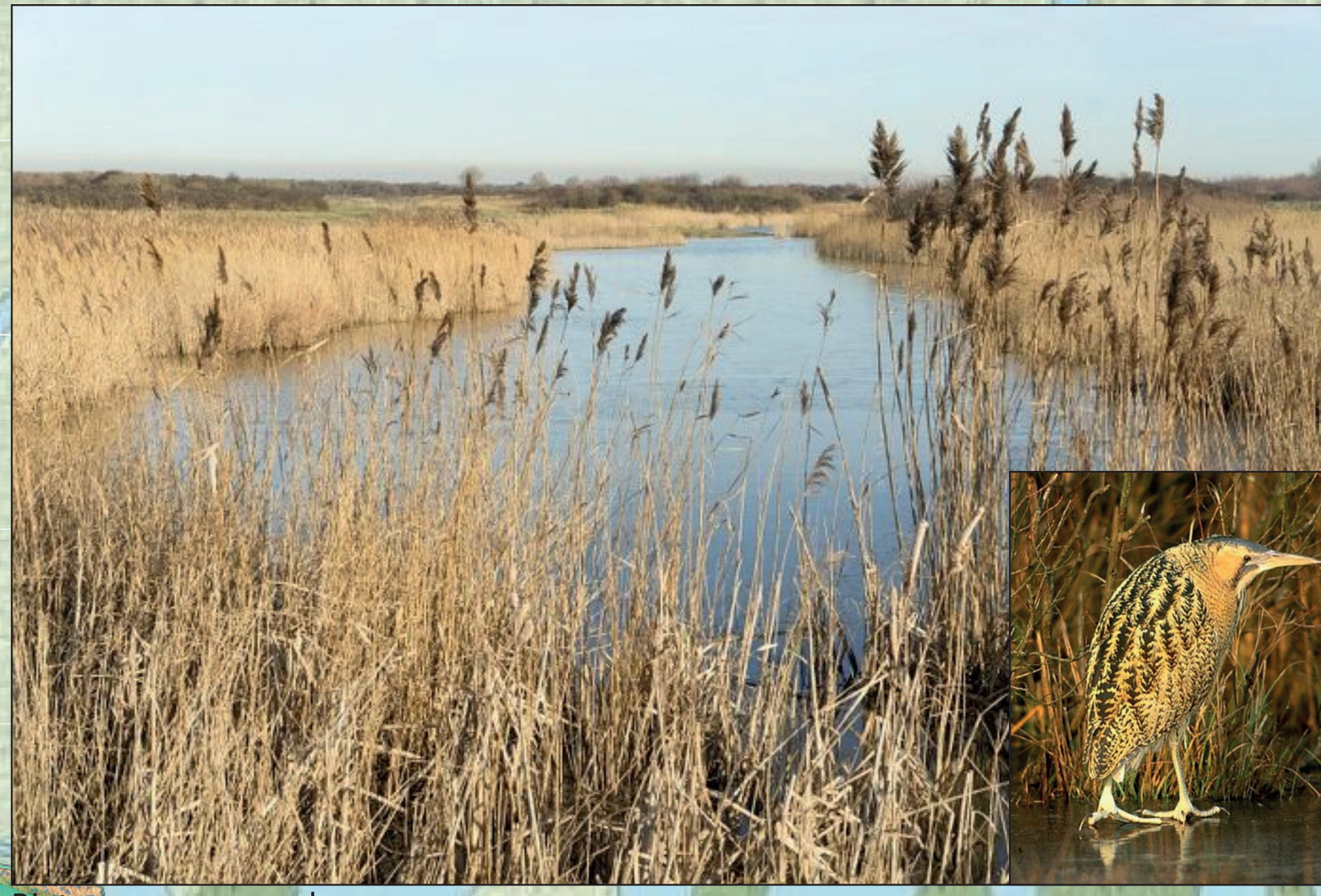
Rietmoeras en roerdomp