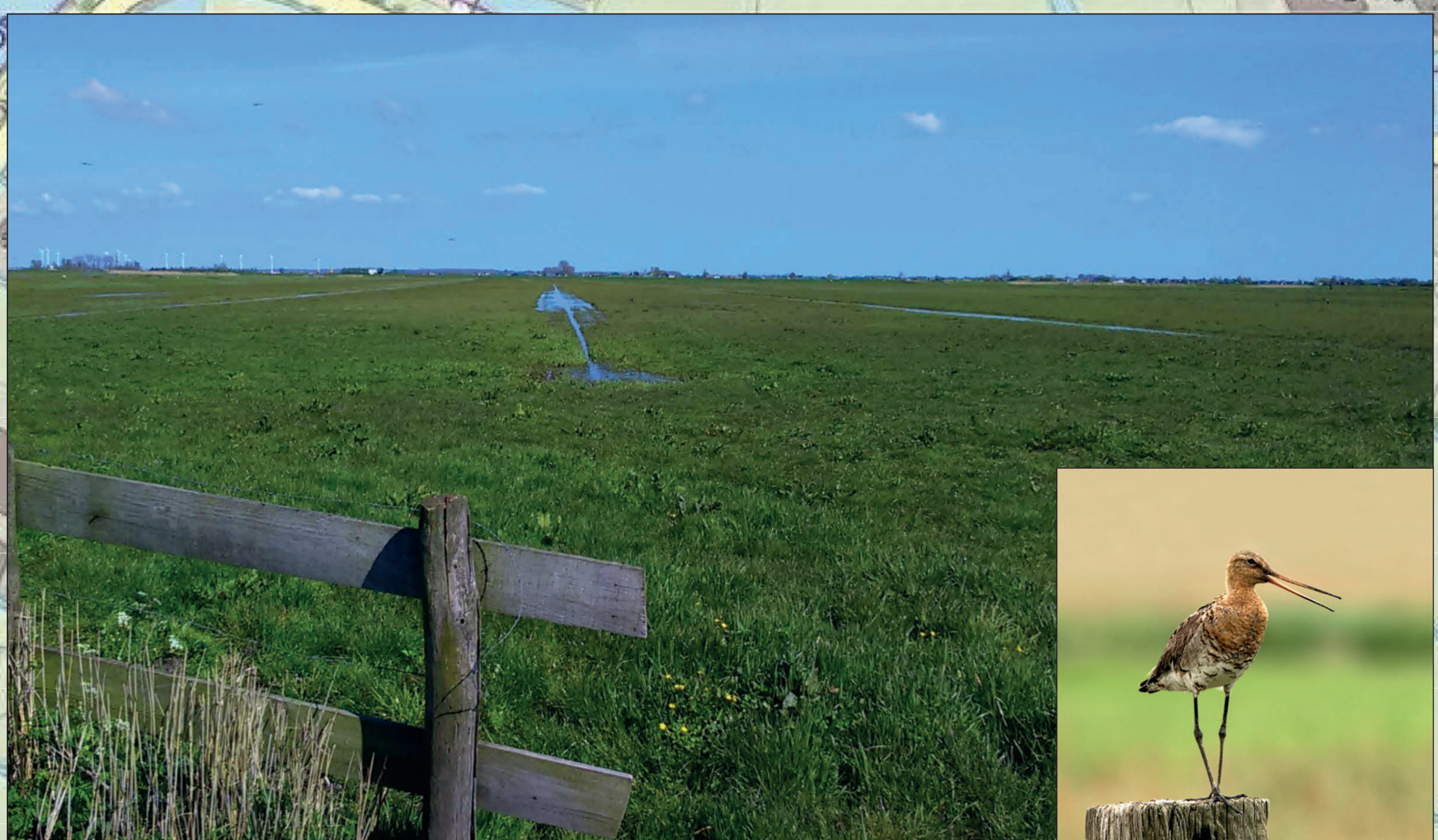
Vochtig weidevogelgrasland, ruimte voor de weidevogels, zoals de grutto