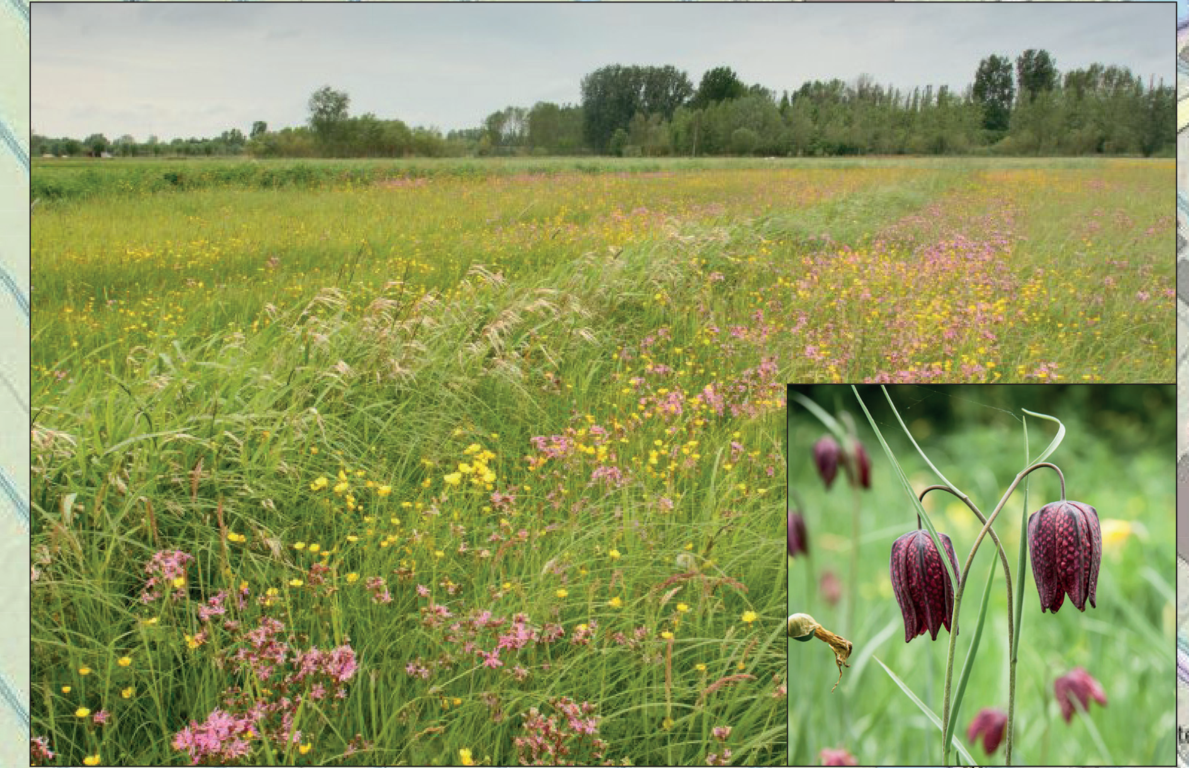
Vochtig hooiland met wilde kievitsbloem