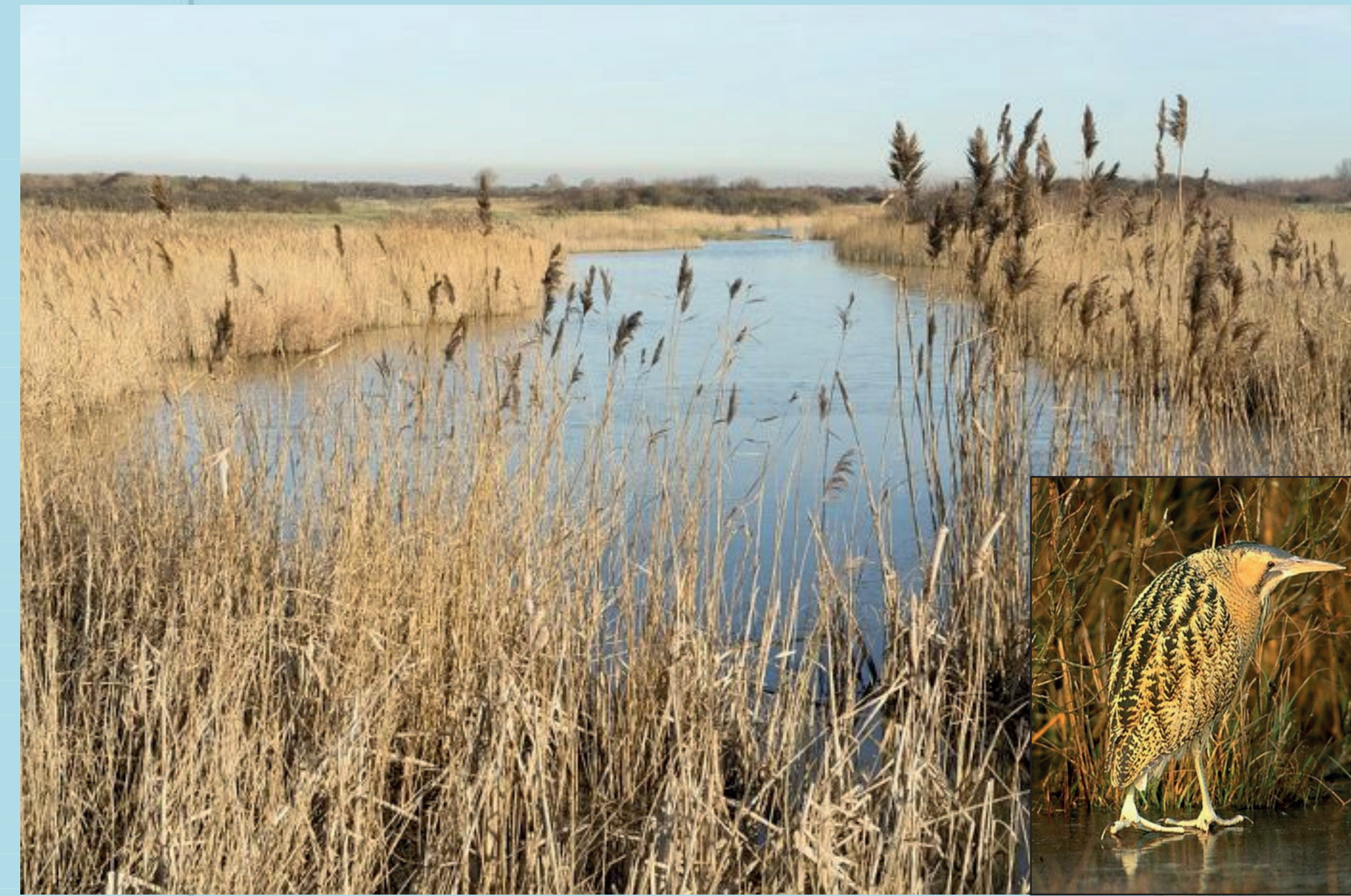
Rietmoeras en roerdomp