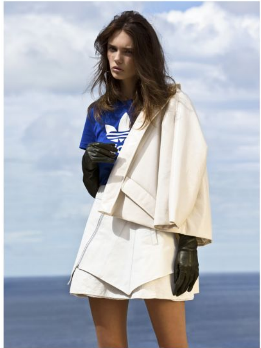
T-shirt by ADIDAS, coat & gloves by MIU MIU, skirt by WILSON AND WOLFE