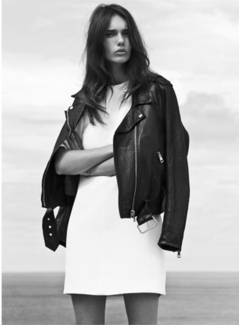
Dress by HARYONO SETIADI, jacket by ACNE