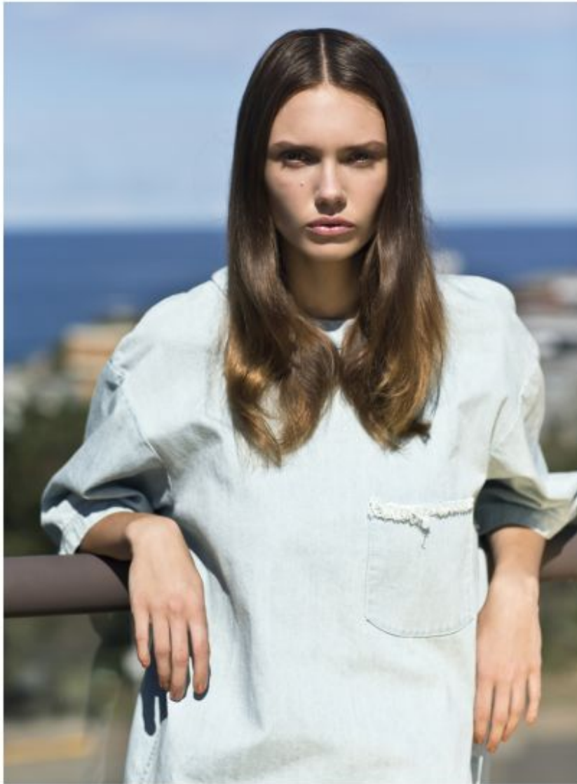
Top by FROM BRITTEN