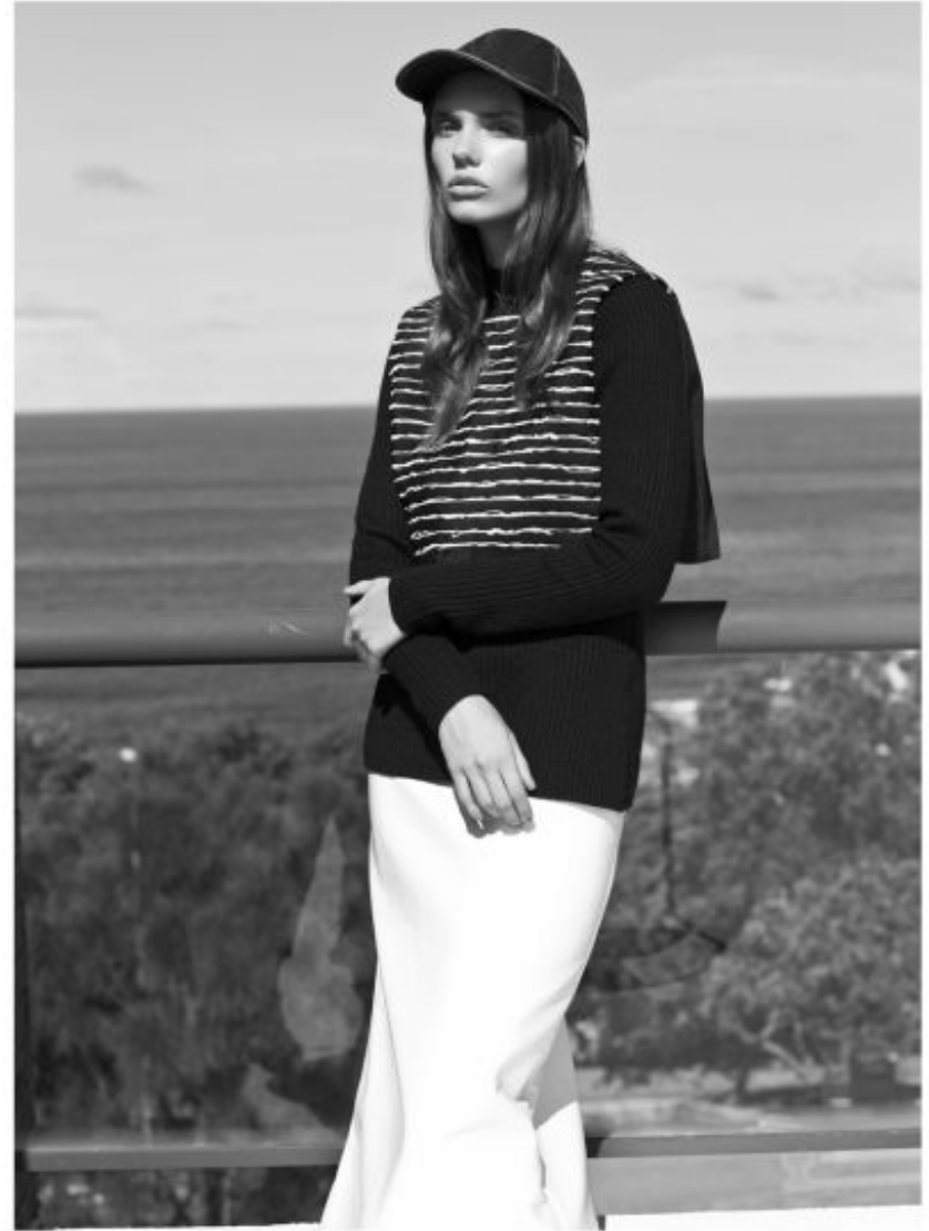
Jumper by CUE, croptop by DOROTA, skirt by MIU MIU, hat by UNIFORM