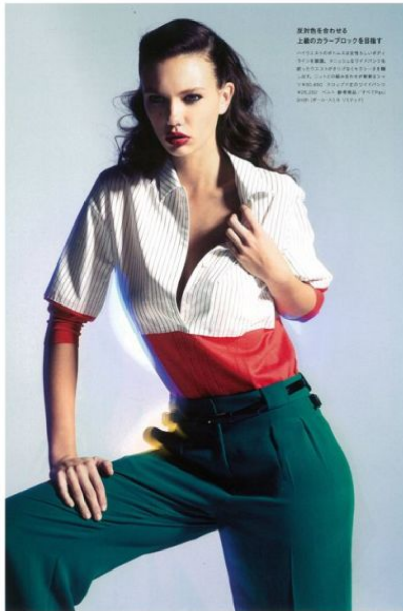
Numero zero 126

反対色を合わせる 上級のカラーブロックを目指す。 このように反対色の組み合わせは定番らしいけれど、 シャツを襟開き、タートルネックやボウタイも 取り入れたスタイルが流行しています。また、 シャツ、ジャケットの組み合わせが定番です。 ジャケット ¥91,800、シャツ ¥22,000、ボウタイ ¥12,000 ¥24,000、ベルト ¥6,000、シューズ ¥12,000 （すべて税込）