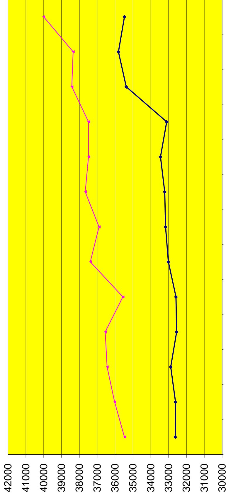
Periode 2009-2010 Siste 12 måneder